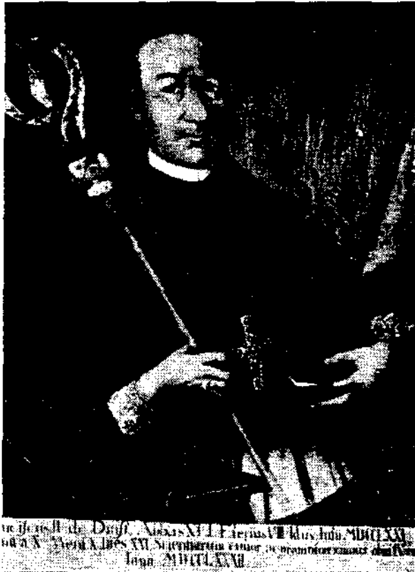
Abt Franz II. von Dinzl (1728–1782)

hatte. In Bd. 5 der „Beschreibung der Diözese Brixen“, der wichtigsten Quelle über das Wirken Franz v. Dinzls in Marienberg, heißt es darüber: „...Es unterliegt keinem Zweifel, daß es nur dem Ansehen, das er bei der Regierung genoß, zu verdanken war, daß eben dem Meraner Gymnasium mit ak. Entschließung vom 8. Sept. 1774 gestattet wurde, sich zu einem Lyzeum zu erweitern, während andere Lehranstalten mit der Sperrung bedroht wurden, weil sie die neu eingeführte Studienordnung zu wenig beobachteten.“ Trotz seiner Bemühungen zog sich die endgültige Verwirklichung dieses Lyzeums bis 1780 hin, weil Marienberg auf Grund einer Verordnung des Jahres 1777 einen eigenen Präfekten stellen sollte, aber Meran die dafür notwendige finanzielle Unterstützung nicht aufbringen konnte (oder wollte). Am 18. Oktober 1780 kam endlich zwischen Marienberg und Meran ein Vertrag zustande, der das Kloster nur verpflichtete, je einen Professor für Logik und Physik zu halten. Das Lyzeum bestand allerdings nur ein Jahr, weil es mehr Widersacher als Gönner hatte“. (Vermutlich hat zur Schließung auch noch eine Rauferei unter den Studenten im April 1781 beigetragen).