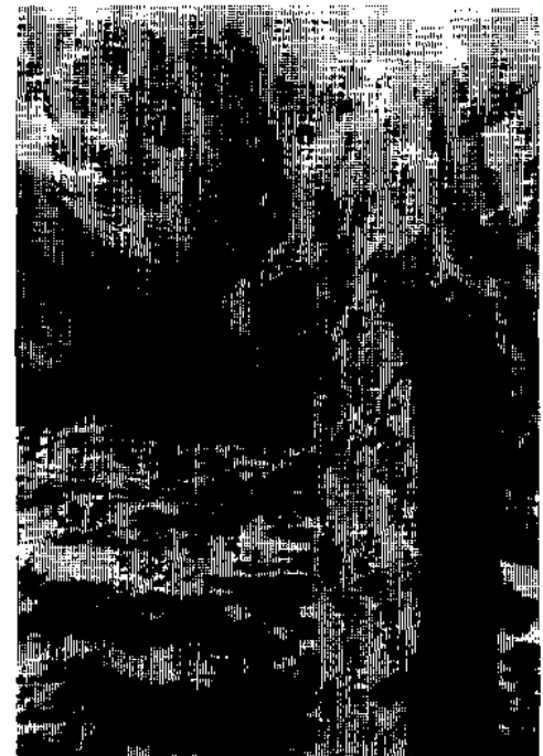
Grenzstein Nr. 6 aus dem Jahre 1753 auf dem Monte Piano