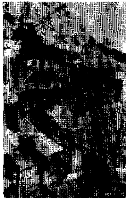
Batallionskommando a Alarmsteige

Oben fesselt unsere Aufmerksamkeit der alte Grenzstein E Nr. 6 vom Jahre 1753.