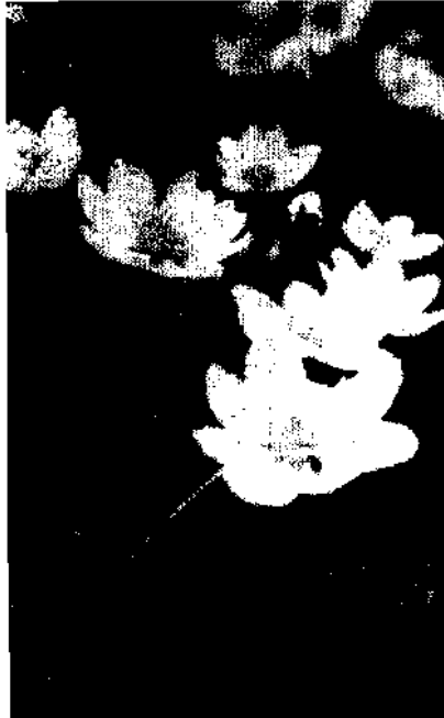
Weißer Alpenanemone, Pulsatilla alpina

c) Wasserspitzmaus ( Nevmys fohiens [Schreiber]) in Fischzuchtanstalten, Ratten (Gattung Rattus ), Mäuse (Gattung Mus , Microtus , Clethrionomys und Apodemus ), Garten- und Siebenschläfer ( Eliomys quercinus [L.] und Glis glis [L.]), Bisamratte ( Ondatra zibethica L.), Nutria- oder Biberratte ( Myocastor coypus [Molina]).