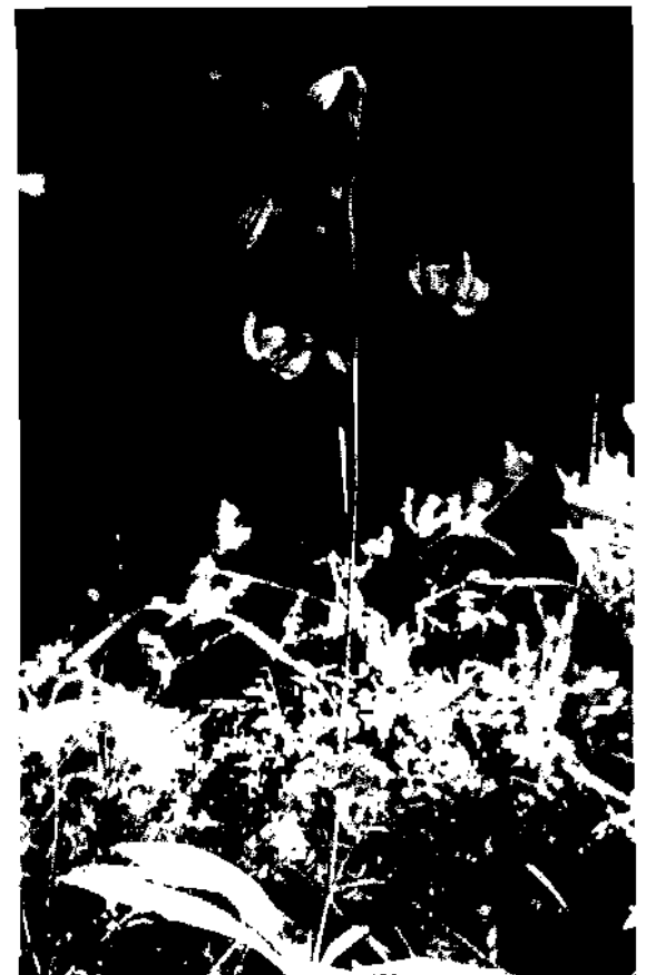
Türkenbund, Lilium mattogon