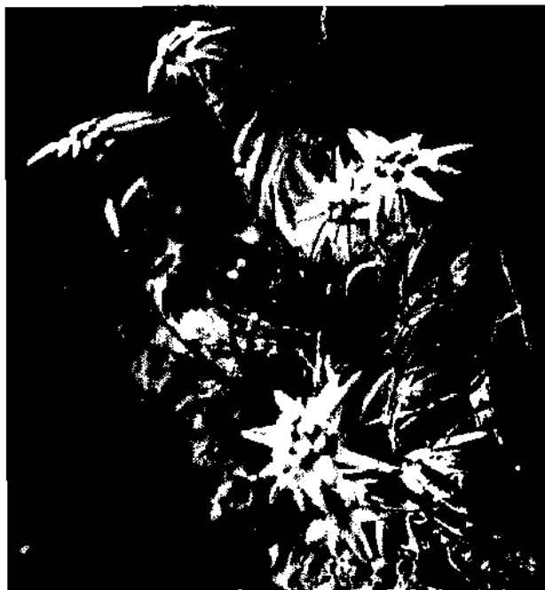
Edelweiß, Leontopodium alpinum