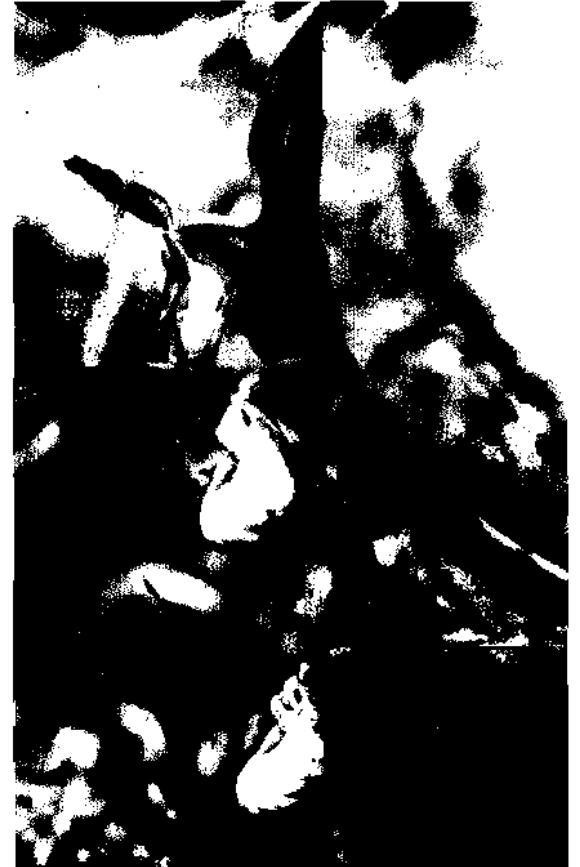
Frauenschuh, Cypripedium calceolus