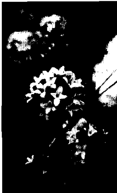
Steinröschen, Daphne striata