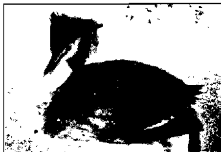
Haubentaucher, März 1987 erschöpft gefunden (Liebherr-Werk)