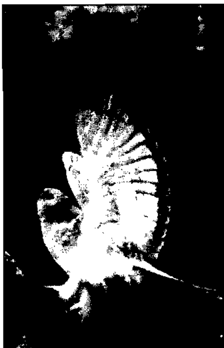
Kornweihe, Dez. 1986 beim Rotkreuz-Heim tot gefunden