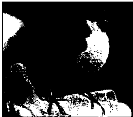
Wasseramsel Wintergast an der Isel