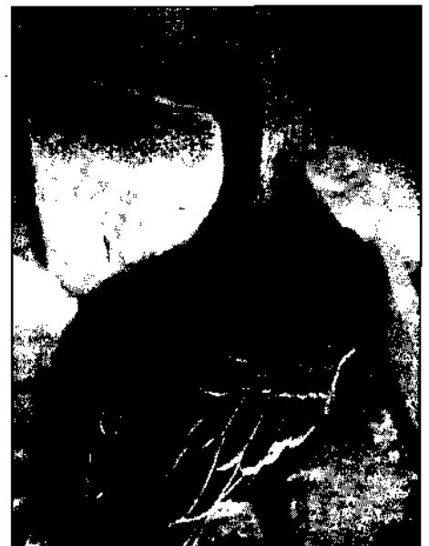
Saatgans, Jänner 1985