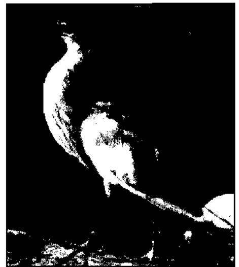
Rallenreiherr, tot gefunden Mai 1987, Lienz