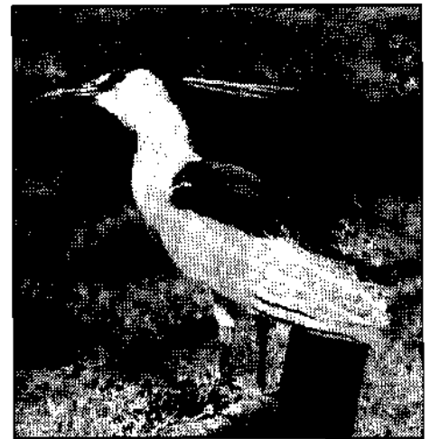
Nachtreiher ( Nycticorax nycticorax ): 1 Ex. bei Amlach am 1. April 1975 gefunden. — Irrgast in Osttirol.

An die Leser sei die Bitte gerichtet, interessante Vogelbeobachtungen in und um Osttirol möglichst unverzüglich an den Verfasser zu melden.