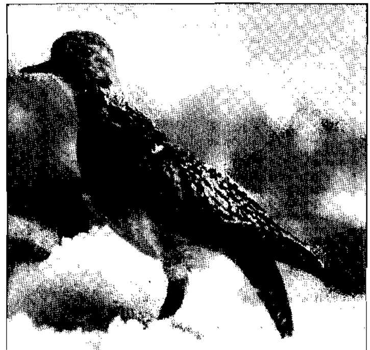
Goldregenpfeifer ( Pluvialis apricaria ): 1 Ex. Ende November 1978 in der Nähe vom Sender Lienz erlegt. Seltener Durchzügler.