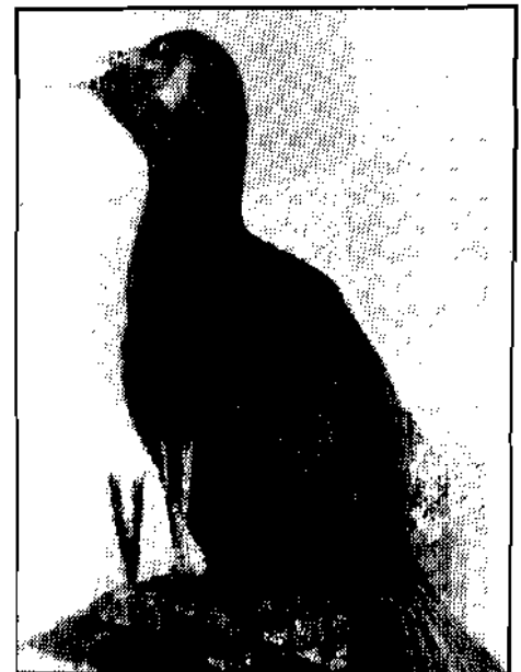
Kormoran ( Phalacrocorax carbo ): Nur mehr sehr selten zu beobachten: November 1979 Bürgerau/Unternußdorf; Winter 1987/88 1 Ex. bei Matrei.