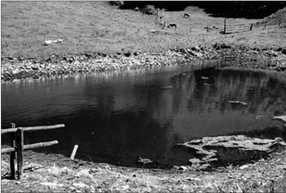
▲ Ranach-Teich bei Wassertiefstand nach Ausfall der Quelle, 29. Mai 1996.