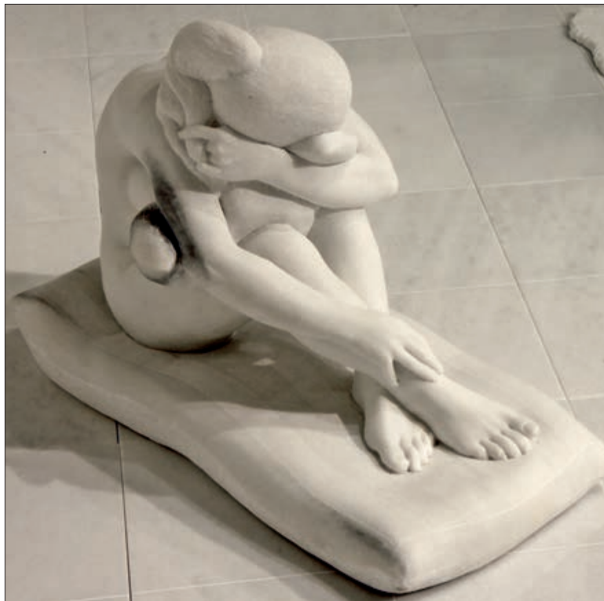
Kauernde, Laaser Marmor, 2008.

In der Neuzeit wurde die Geschichte auch als ein Gleichnis für die Unfähigkeit der Bildhauerei ausgelegt, lebendige Kreaturen zu schaffen oder zumindest die Leidenschaft des Rezipienten durch optische Stimuli zu entfachen. Des Öfteren nahmen Maler – die man heute vielleicht nicht