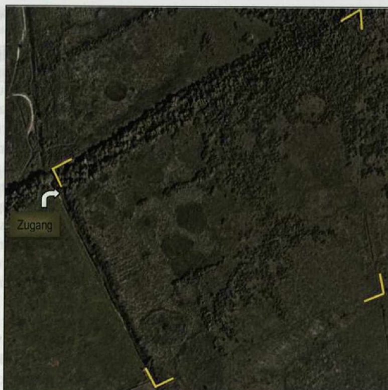
Abb. 2: Kontrollfläche im NSG Kremmener Luch/OHV.