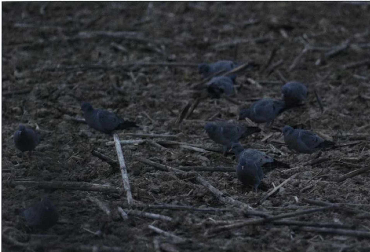
Abb. 10: Hohltauben, Angermünde/UM, März 2009.

Fig. 10: Stock Doves Columba oenas , Angermünde/UM.