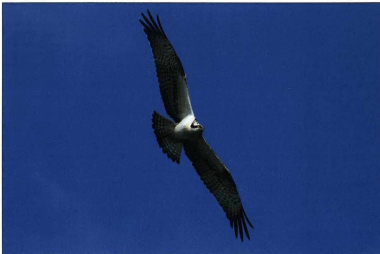
Abb. 5: Fischadler, Lietzen/MOL, Oktober 2009.

FISCHADLER Pandion haliaetus : Brut: in Brandenburg 319 Rev. (RYSLAVY in Vorb.). Erstbeob.: 15.Mär 1 Raddusch/OSL (W.Köhler) * 16.Mär 1 Riewend/PM (G.Lohmann) * 18.Mär je 1 Nieplitznied. Zauchwitz (L.Kalbe) und Arnsdorf/OSL (T.Schneider). Frühjahr: abseits unmittelbarer Horstnähe max. 21.Apr 4 Fohrder Wiesen/PM (W.Mädlow). Sommer/Wegzug, Gebietsmax. ab 5 Ex. (ohne BP): 25.Jul 5 Kiesecken Mühlberg/EE (HH, H.Michaelis, T.Schneider, W.Schreck) * 9.Aug 6 Grimnitzsee (HH, W.Schreck) * 11./25.Aug 5 Talsperre Spremberg (RB) * 19.Aug 8 Blankensee-Nieplitznied. Zauchwitz (BR, K.Urban) * 22.Aug 5 Gülper See (C.Braunberger). Letztbeob.: 7.Okt je 1 Güstebieser Loose (RF) und Marquardt/P (D.Lehmann) * 17./20.Okt 1 Nieplitznied. Stangenhagen (D.Ferus) * 19.Okt 1 Blankensee (L.Kalbe) * 30.Okt 1 dz. Neukölln/B (J.Herrmann).