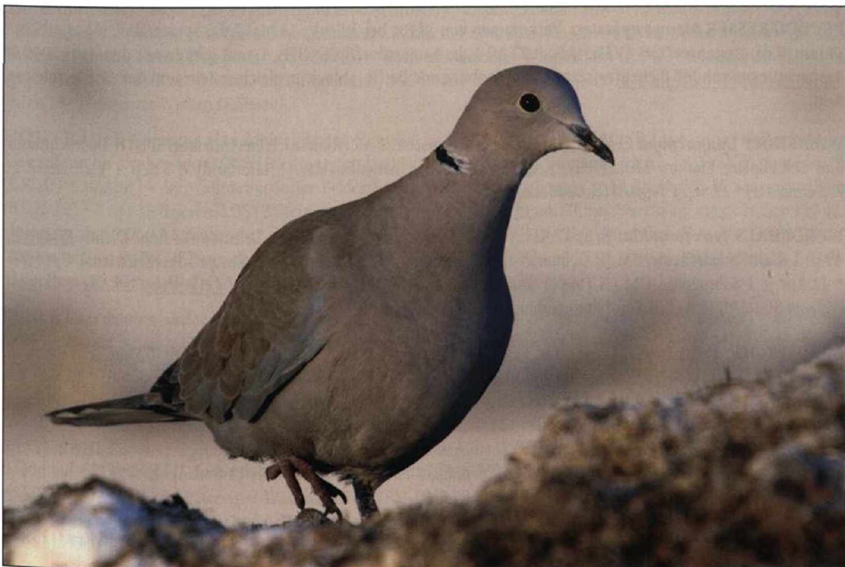
Abb. 11: Türkentaube, Lüdersdorf/TF, Januar 2009.

Fig. 10: Stock Doves Columba oenas , Angermünde/UM.