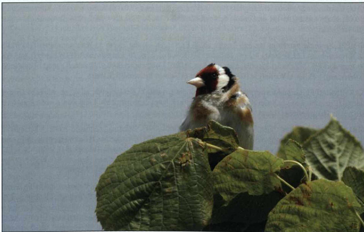
Abb. 15: Stieglitz, Pinnow/UM, Juni 2009. Fig. 15: European Goldfinch Carduelis carduelis , Pinnow/UM.

BERGHÄNFLING Carduelis flavirostris : Winter und Heimzug 1.038 Ex. bei 25 Beob., Trupps ab 50 Ex.: 5.Jan 50 Schwedt/UM (D.Krummholz) * 10.Jan 120 Zinnitz/OSL (P.Schonert) * 14.Jan 80 Zützen/UM (D.Krummholz) * 17.Jan 120 Riesdorf/TF (F.Eidam) * 31.Jan 53 Großziethen/LDS (A.Kormannshaus) * 14.Feb 152 Ziltendorfer Nied. (HH). Heimzug, Letztbeob.: 24.Mär 30 Herzsprung/UM (JM) * 29.Mär 17 Schönefeld/LDS (F.Sieste) * 2.Apr 15 Lenzen/PR (T.Heinicke). Wegzug, 843 Ex. bei 18 Beob.: Trupps ab 50 Ex.: 3.Okt 50 Zachow/HVL (M.Löschau) – gleichzeitig Wegzug Erstbeob. *