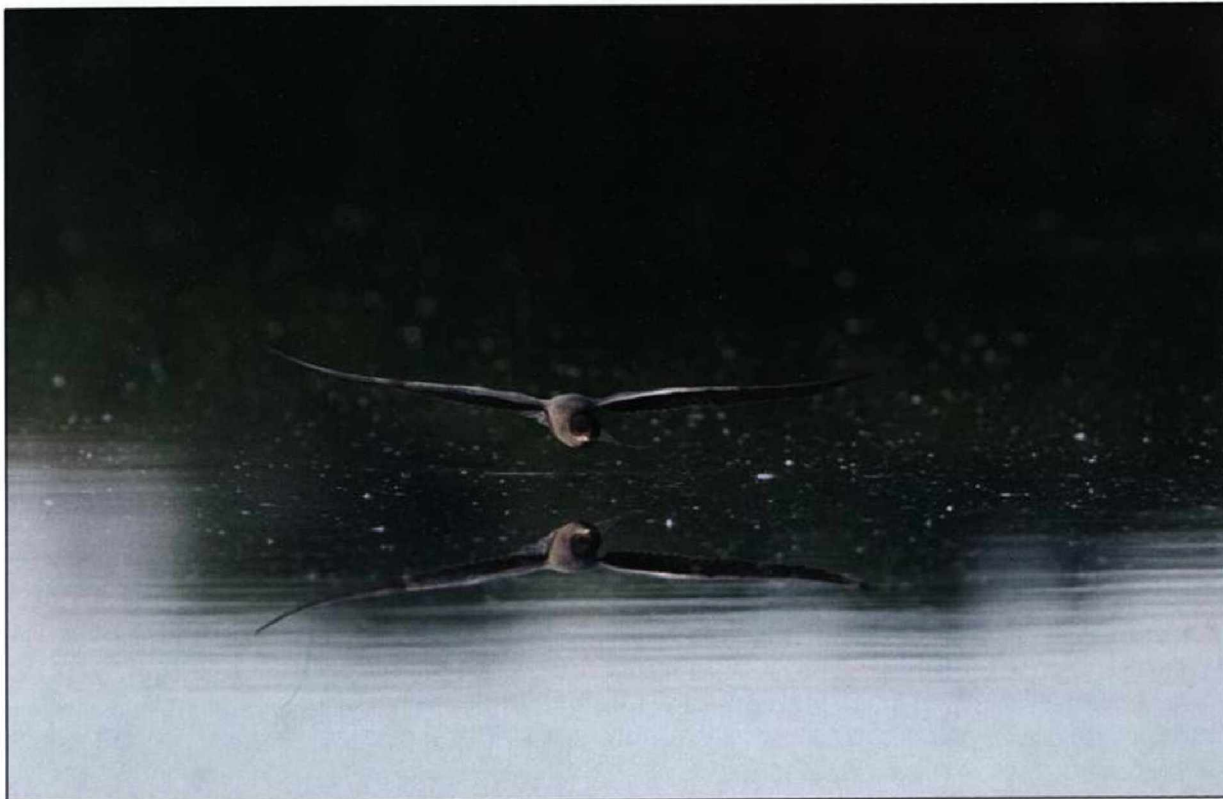
Abb. 9: Trauerseeschwalbe, Weibchen, Untere Havelniederung/HVL, Mai 2009.