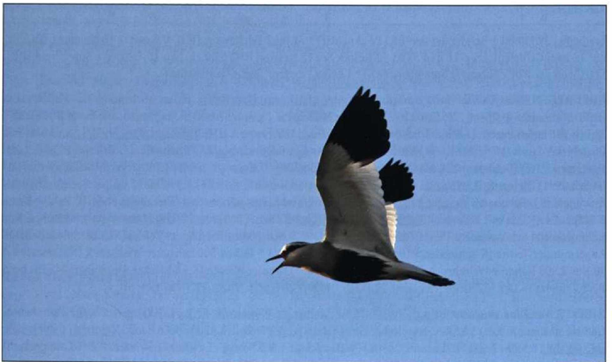
Abb. 7: Steppenkiebitz, Schönerlinde/BAR, Mai 2009.

5.500 Gülper See (T.Langgemach) * 14.Sep 4.600 Neumeichow/UM (JM) * 22.Sep 8.000 Geesow/UM (J.Haferland). 2.Okt 4.000 Zuckerfabrikteiche Prenzlau (JM) * 19.Okt 3.000 Niederlandin/UM (WD) * 27.Okt 4.600 Angermünder Teiche (JM) * 28.Okt 11.000 Altfriedländer Teiche (MF) * 17.Nov 5.500 Linumer Teiche (T.Langgemach). Dezember . 5.763 Ex. in 28 Gebieten (Wertung der Max. je Gebiet), max. 3.Dez 1.000 Welsebruch Biesenbrow/UM (E.Henne) * 14.Dez 1.200 Elbnied. Gaarz-Wootz/PR (Naturwacht).