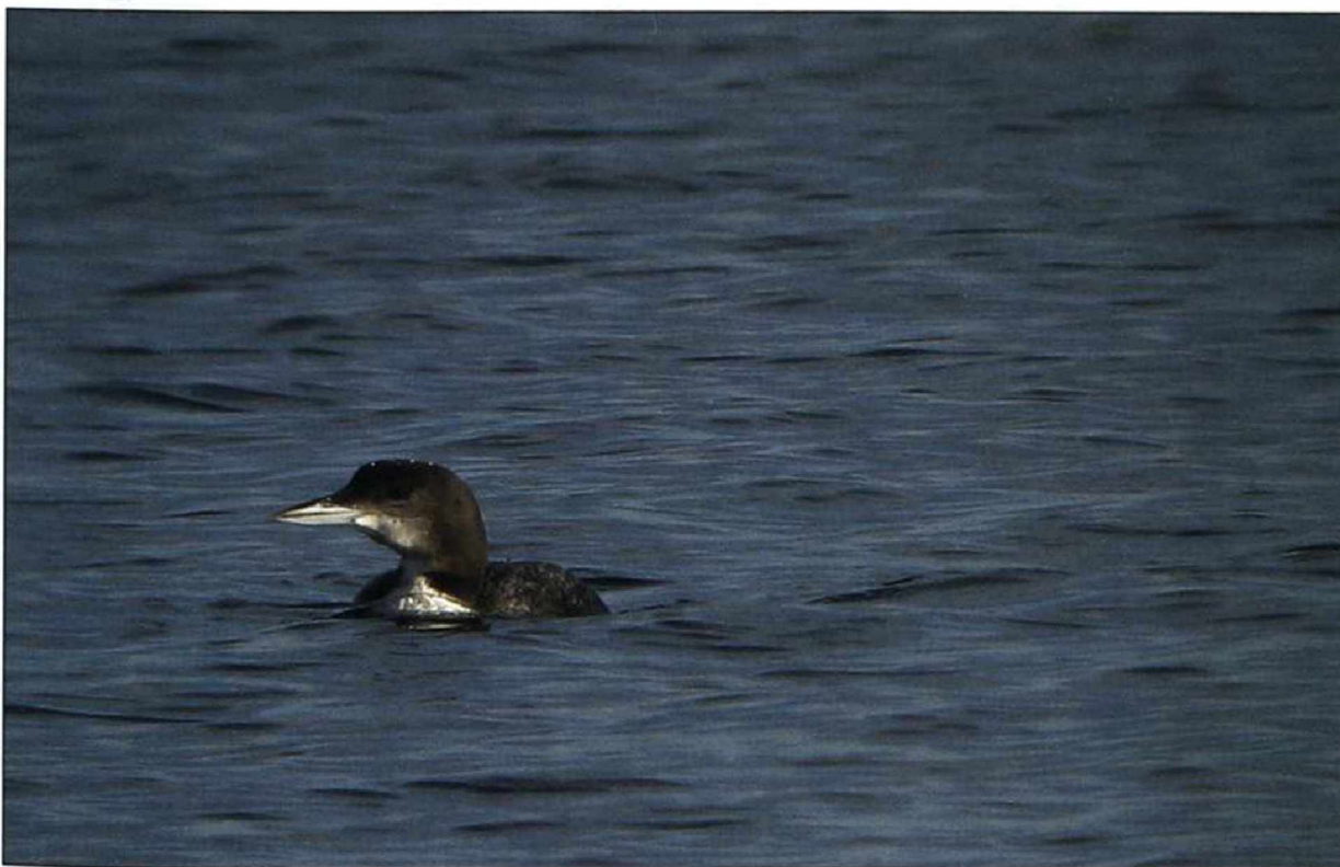
Abb. 3: Eistaucher, K1, Senftenberger See/OSL, Dezember 2009.

EISTAUCHER Gavia immer : 5. Dez-2. Jan 2010 1 dj. Senftenberger See/OSL (H.Michaelis, T.Schneider u.a., DSK 2010). Mit diesem achten Nachweis zählt der Eistaucher immer noch zu den sehr seltenen Gastvögeln in Brandenburg und Berlin.