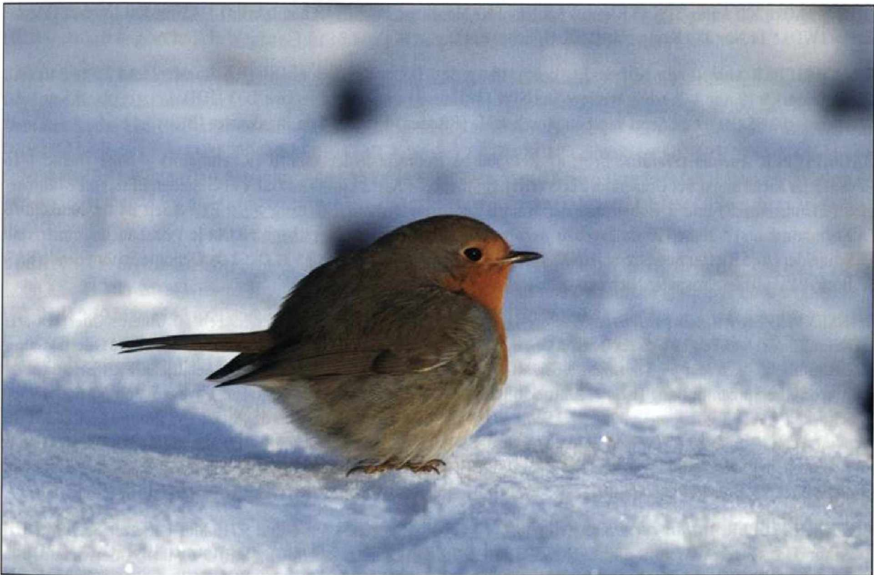
Abb. 13: Rotkehlchen, Potsdam, Januar 2009.