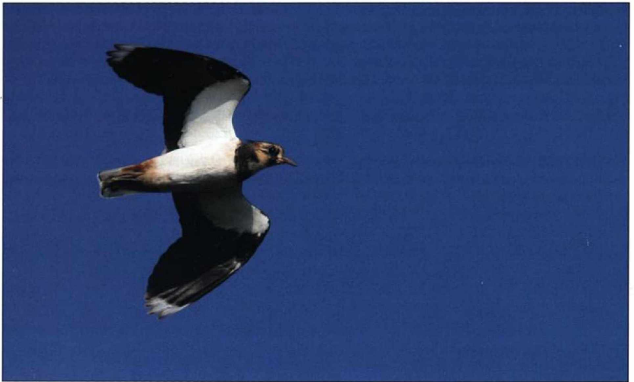
Abb. 6: Kiebitz, Neulewin/MOL, Oktober 2009.

Fig. 6: Northern Lapwing Vanellus vanellus , Neulewin/MOL.