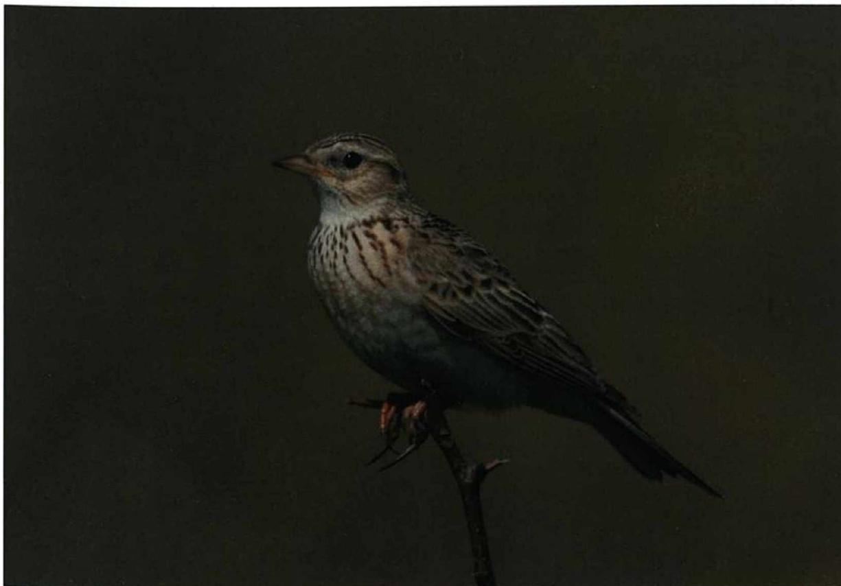
Abb. 12: Feldlerche, Brunow/MOL, Mai 2009.

UFERSCHWALBE Riparia riparia : Brut, Erfassung in größeren Gebieten : 600 BP an 13 Brutplätzen Altkreis Angermünde (U.Kraatz, S.Lüdtke, JM.). Kolonien ab 200 BP : 800 BP Groß Ziethen/BAR (JM) * 500 BP Buchholz/UM (Seybold) * 277 BP Schlabendorfer See/LDS (G.Wodarra) * 260 BP Dobberzin/UM (JM) * 235 BP Lichtenauer See/OSL (G.Wodarra) * 200 BP Wichmannsdorf/UM (W.-H.Seybold) * 200 BP Stiebsdorfer See/LDS (G.Wodarra). Erstbeob. : 14.Apr 1 Eichpark/B (O.Häusler) * 15.Apr 2 Lietzengrabennied./B (M.Süsser) * 18.Apr 1 Rietzer See-Streng (HH). Wegzug, Ans. und Zug ab 500 Ex. : 1.Aug 600 Kieseeseen Mühlberg/EE (HH) * 23.Aug 1.400 SP Gülper See (W.Schreck) * 5.Sep 2.500 SP Blankensee (HH) * 6.Sep 6.300 dz. ebd. (BR, K.Urban) und 1.500 Grimnitzsee (HH). Letztbeob. : 7.Okt 1 Alte Spreemündung (HH) * 8.Okt 1 dz. Schwedt/UM (JM).