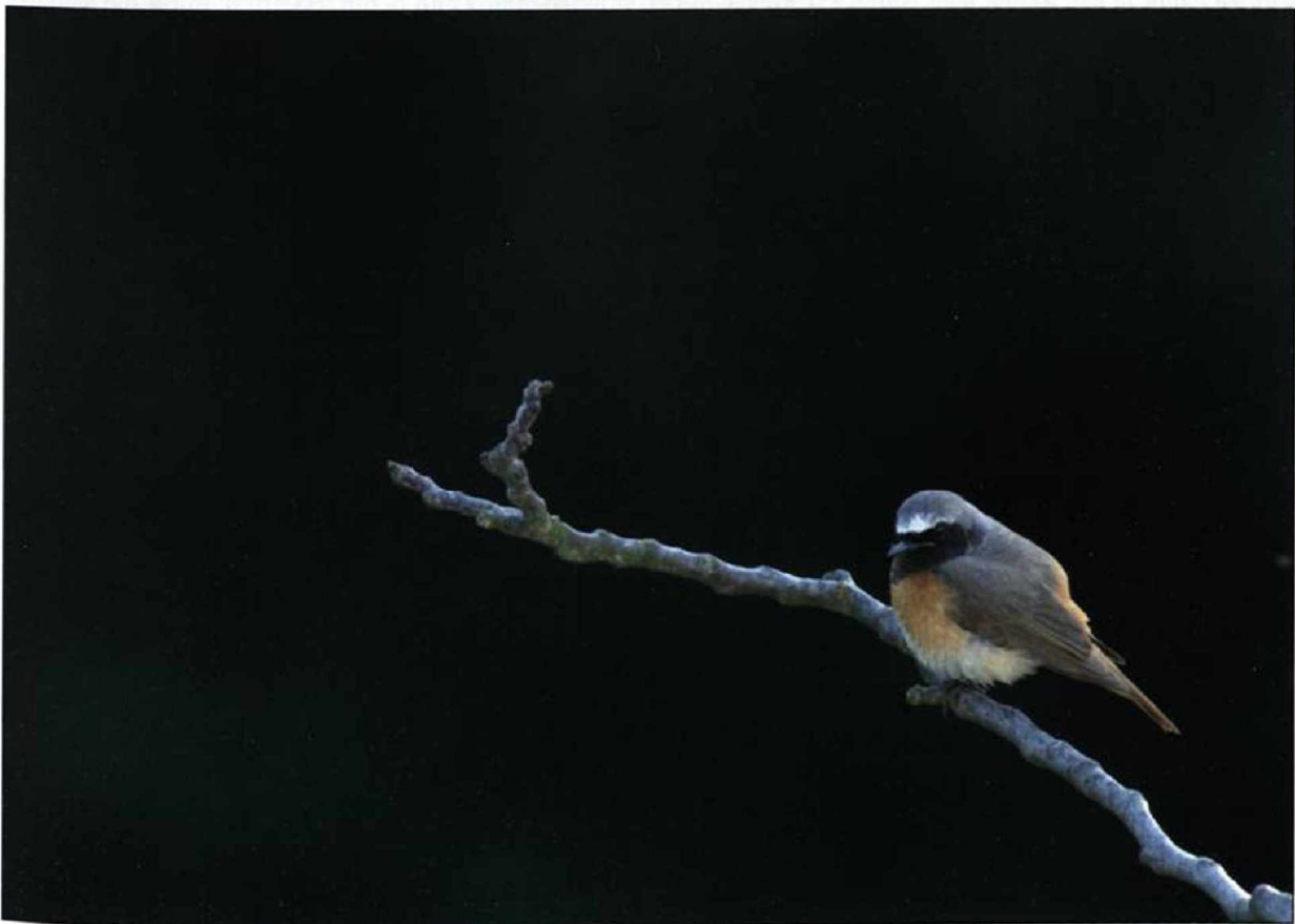
Abb. 14: Gartenrotschwanz, Männchen, Potsdam, Juni 2009.