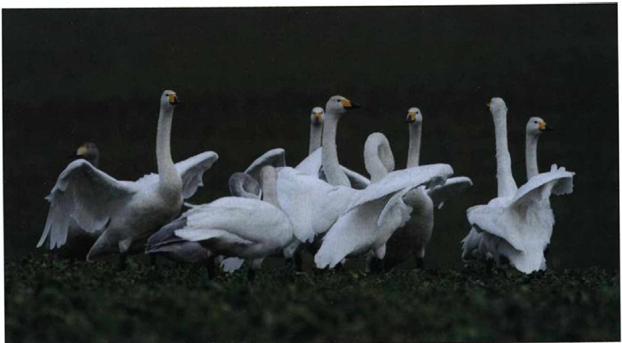
Abb. 1: Singschwäne, Lüdersdorf/BAR, Februar 2009.

Auch während der Herbststrast gab es beim Silberreiher mit 213 Individuen in den Peitzer Teichen ein neues Gebietsmaximum. Nennenswerte Ansammlungen stellten auch 1.012 Schnatterenten auf dem Rietzer See-Streng, 75.150 Kraniche