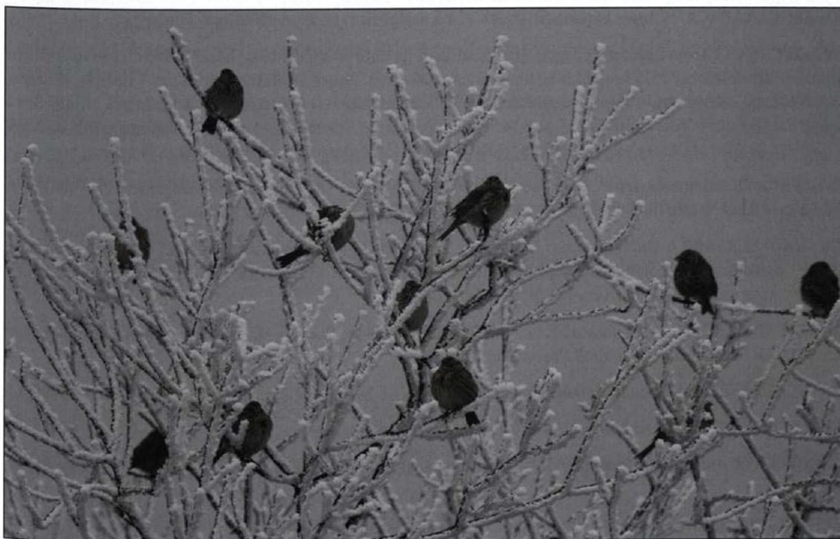
Abb. 16: Grauammern, Frauenhagen/UM, Januar 2009.

GRAUAMMER Miliaria calandra : im ersten Halbjahr, Trupps ab 300 Ex.: 1.Jan 400 Brädikow/HVL (S.Fischer, H.Watzke) * 6.Jan 450 Angermünde/UM (S.Fischer, H.Watzke) * 14.Jan 300 Frauenhagen/UM (U.Kraatz) * 17.Jan 450 Ziltendorfer Nied. und 1.200 Döbberin/MOL (HH) * 15.Feb 300 Tagebau Seese-Ost/OSL (S.Rasehorn) * 16.Apr 300