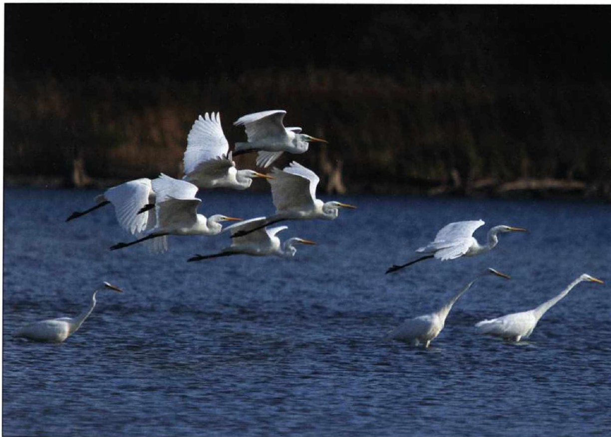
Abb. 4: Silberreiher, Altfriedländer Teiche/MOL, Oktober 2009.