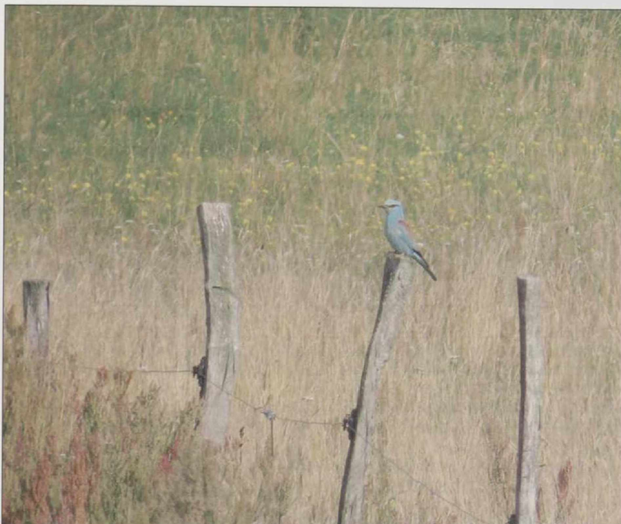
Abb. 2: Blauracke in Melchow/Barnim, 17.7.2013.