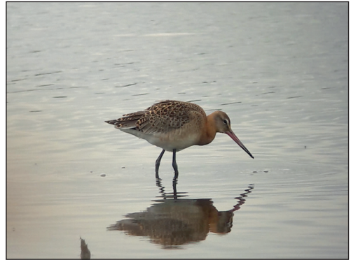
Abb. 3: Belegaufnahme einer Isländischen Uferschnepfe vom 28.09.2018, Stradower Wiesenteich/OSL.

Fig. 2: Photographic proof of a British Yellow-crowned Wagtail M. f. flavissima , 19.09.2015, east of Groß Machnow/TF).