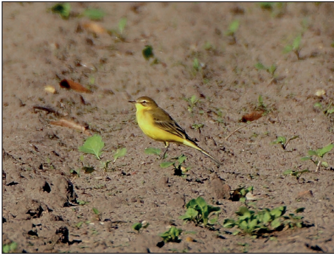
Abb. 2: Belegaufnahme einer Gelbkopf-Schafstelze vom 19.09.2015, östlich Groß Machnow/TF.

ge Rast einer Kanadapfeifente , Anas americana , in den Körziner Wiesen/PM. Ein weiterer seltener Vogel überraschte sogar mit einer mehrwöchigen Rast im Frühsommer. Im Spreewald konnte an den Schlepziger Teichen und Umland/LDS ein Steppenkiebitz , Vanellus gregarius , vom 10.06. bis 27.06.2018 von zahlreichen Beobachtern bestätigt werden. Der Sommer verlief ohne größere Besonderheiten. Die Niederschlagsdefizite ließen im Spätsommer an Stand- und Fließgewässern lokal günstige Rastbedingungen für Limikolen zu. Neben den häufig durchziehenden Arten hat vermutlich ein Sturm eine Isländische Uferschnepfe , Limosa l. islandica , weit ins Binnenland verschlagen. Der Vogel blieb über einen Zeitraum von 16 Tagen und konnte von zahlreichen Beobachtern gesehen werden (Abb. 3). Der letzte Nachweis dieser Unterart der Uferschnepfe für Brandenburg datiert aus dem Jahr 2002 (DSK 2008).