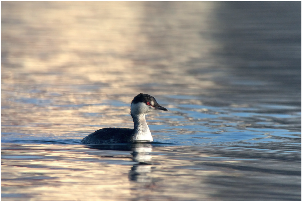
Abb. 2: Ohrentaucher, Heiliger See/P, Dezember 2016.