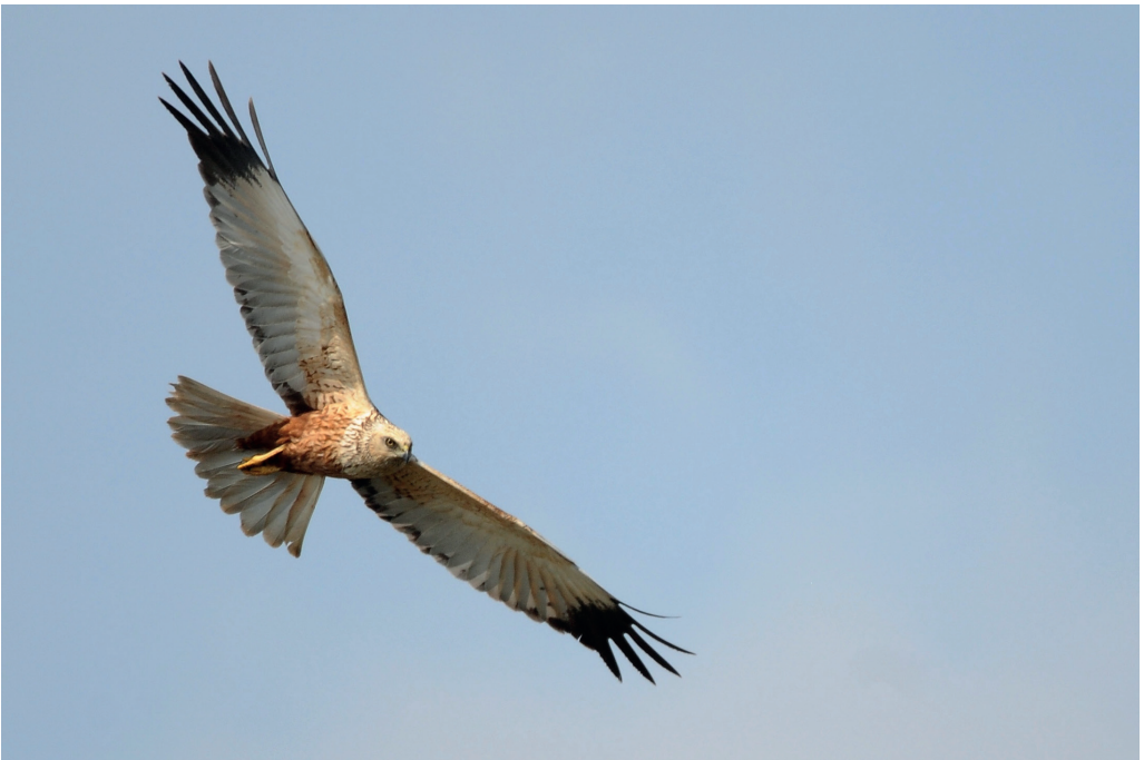
Abb. 8: Rohrweihe, Männchen, Reetz/PM, Mai 2016. Fig. 8: Western Marsh Harrier, male, Circus aeruginosus.