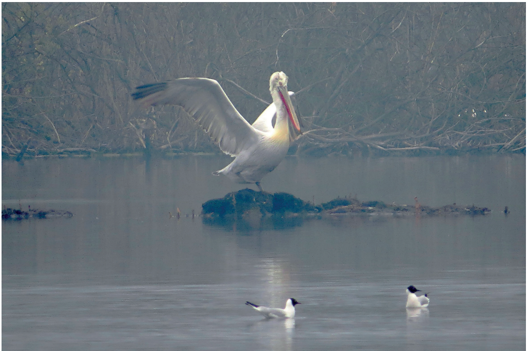
Abb. 5: Krauskopfpelikan, Altvogel, Altfriedländer Teiche/MOL, April 2016. Fig. 5: Dalmatian Pelican, Pelecanus crispus .