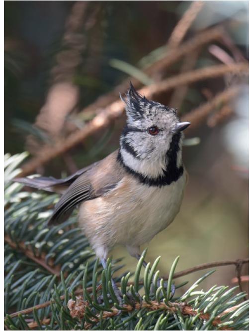
Abb. 11: Haubenmeise, Potsdam/P, September 2016.

Heidelerche Lullula arborea : Erstbeob. : 13. Feb 1 Passow/UM (T.Becker) * 27. Feb je 1 Tagebau Welzow-Süd/SPN (RB) und Unteres Odertal Schwedt (DK) * 29. Feb 1 Krugauer Heide/LDS (T.Noah). Heimzug, max. : 18. Mär 30 Poleysee/EE (TS)