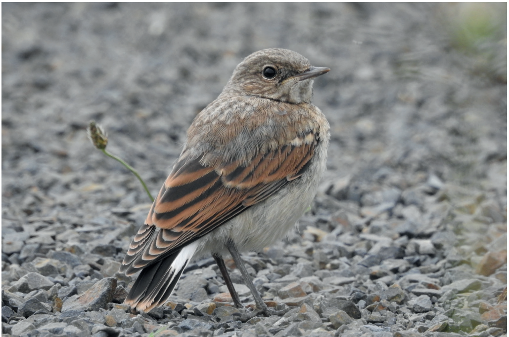
Abb. 14: Steinschmätzer, Jungvogel, Eberswalde/BAR, Juli 2016. Fig. 14: Northern Wheatear, juv., Oenanthe oenanthe .

Schwarzkehlchen Saxicola rubicola : Brut, Konzentrationen: 15 Rev./400 ha Ferbitzer Bruch/P (L.Pelikan) * 14 Rev./400 ha Rathenow/HVL (A.Kabus, T.Langgemach) * 23 Rev. Welsebruch Passow-Kummerow/UM (S.Lüdtke) * 18 Rev. Gatower Rieselfeld/B (E.Wolf). Erstbeob.: 7.Mär 1 M Gatower Flugplatz/B (A.Federschmidt) * 16.Mär 5 M in 4 Gebieten. Nachbrutzeit/Wegzug, Ans. > 10 Ex.: 18.Sep 11 Wartenberger Felder/B (S.Materna) * 23.Sep 14 Gatower Rieselfeld/B (A.Federschmidt) * 25.Sep 17 Falkenberger Rieselfeld/B (R.Schirmeister) und 15 Rieselfelder Großbeeren/TF (L.Gelbicke) * 14.Sep/3.Okt je 12 Neuzeller Wiesen/LOS (C.Pohl). Letztbeob.: 30.Okt 4 Ex. in 3 Gebieten * 31.Okt 1 M Gatower Flugplatz/B (E.Wolf) * 3.Nov 1 W Unteres Odertal Friedrichsthal (UK). Dezember, 2 Ex.: 7.Dez 1 M Klärwerksabteiler Waßmannsdorf/LDS (L.Gelbicke) * 16./17.Dez 1 W Malxenied. Dissen/SPN (D.Robel).