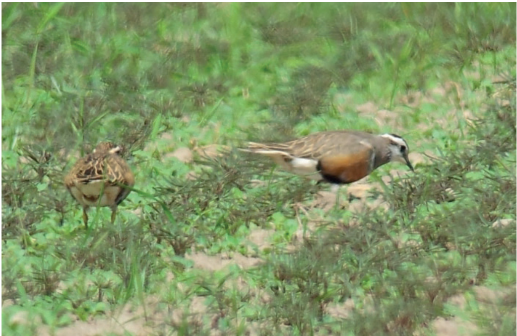
Abb. 3: Mornellregenpfeifer, Lübben/LDS, Mai 2016. Fig. 3: Eurasian Dotterel, Charadrius morinellus .

Großer Brachvogel Numenius arquata : Brut: in Brandenburg 35 Rev. (RYSLAVY in Vorb.). Im Winter (Jan, Feb) keine Beob. Heimzug, Erstbeob.: 5.Mär 1 Havelnied. Parey (F.Drutkowski, N.Vilcsko, C.Neumann) * 8.Mär 1 Belziger Landschaftswiesen/PM (P.Schubert) * 10.Mär 1 Unteres Odertal Schwedt (DK). Heimzug, Gebietsmax. ab 5 Ex.: 1.Apr 5 Landwehr/LDS (S.Guth) * 2.Apr 13 Havelnied. Parey (R.Schneider) * 3.Apr 8 Jänschwalder Wiesen/SPN (D.Robel) * 6.Apr 7 Spaatzter Luch/HVL (K.Schulze) * 14.Apr 31 NSG Lietzengraben/B (C.Pohl, z.T.I.Pepper) * 31.Mai 10 Belziger Landschaftswiesen/PM (M.Detel). Wegzug, Gebietsmax. ab 10 Ex.: 3.Jul 12 Randowbruch Wendemark/UM (N.Vilcsko) * 4.Aug 17 dz. Elbe bei Hinzdorf/PR (S.Jansen) * 21.Aug 20 dz. Karthanenied. Klein Lübben/PR (S.Jansen) * 21.Aug 14 dz. Jungfernsee/P-B (L.Pelikan) * 26.Aug 17 dz. Alte Oder Schwedt/UM (JM) * 6.Sep 10 Lenzer Wische/PR (H.Schumann, I.Grunwald) * 11.Sep 49 Gülper See (N.Vilcsko, B.Kreisel) * 13.Sep 12 dz. Havelländisches Luch Garlitz/HVL (K.Hallmann)