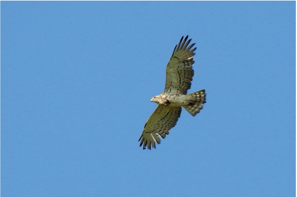
Abb. 7: Schlangenadler, Havelländisches Luch/HVL, Juli/August 2016. Fig. 7: Short-toed Snake Eagle, Circaetus gallicus.