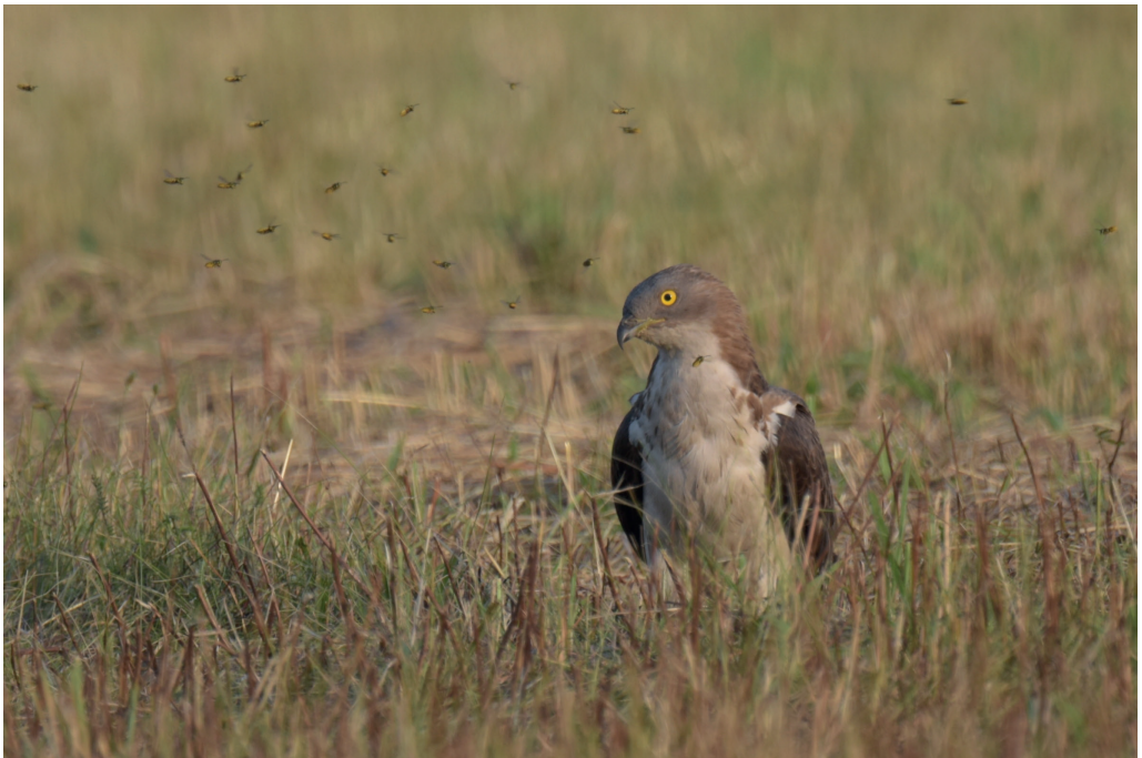
Abb. 6: Wespenbussard, Schiaß/TF, Juli 2016. Fig. 6: European Honey Buzzard, Pernis apivorus .