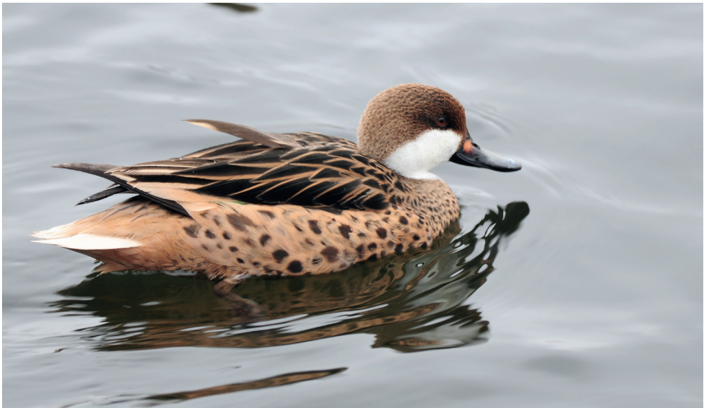
Abb. 16: Bahamaente, Potsdam/P, Januar 2016.

Fig. 16: White-cheeked Pintail, Anas bahamensis .