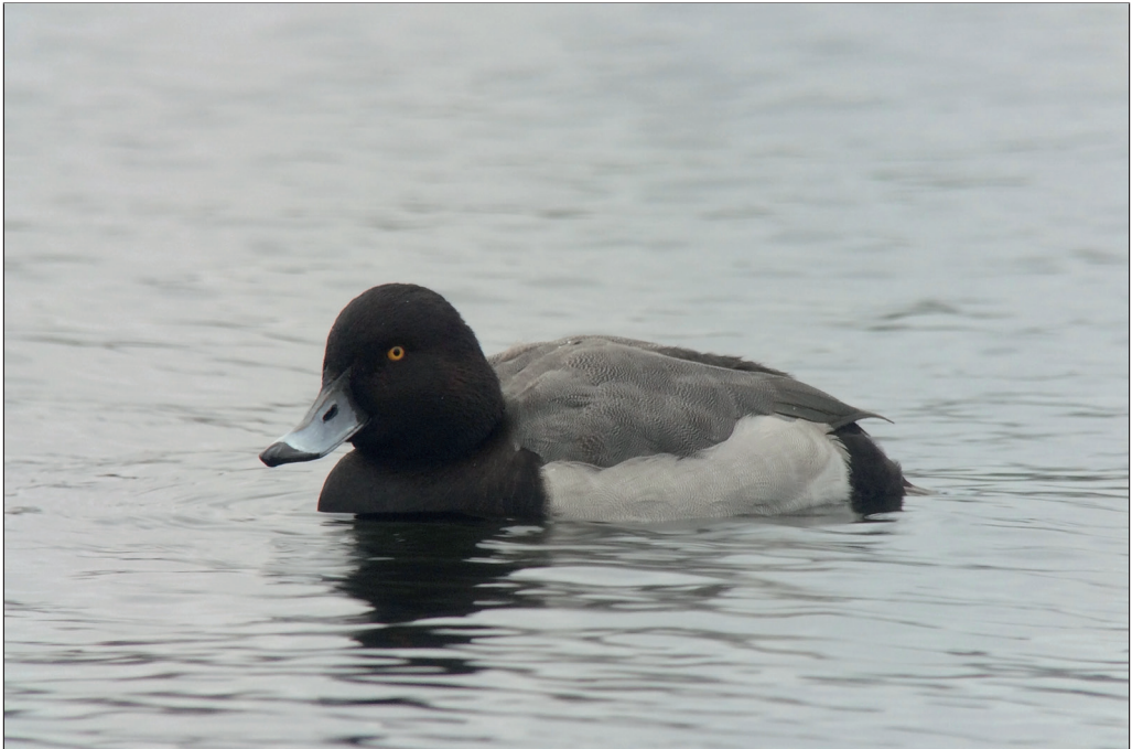
Abb. 1: Hybrid Reiherente x Tafelente, Heiliger See/P, Dezember 2016. Fig. 1: Hybrid Tufted Duck x Common Pochard, Aythya fuligula x Aythya ferina .

Bergente Aythya marila : vor allem im Herbst sehr starkes Auftreten von insg. 547 Ex. bei 100 Beob. (Wertung der Monatsmax. pro Gebiet):