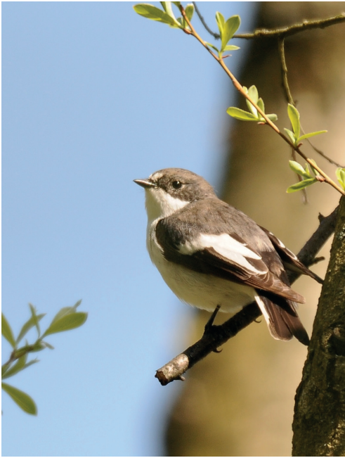
Abb. 12: Trauerschnäpper, Hohenwalde/FF, April 2016.

Fig. 12: European Pied Flycatcher, Ficedula hypoleuca .