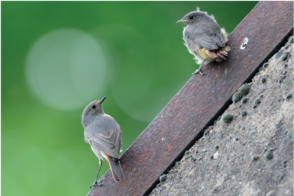
Abb. 13: Hausrotschwänze, Altvogel mit Jungvogel, Kleinrössen/EE, Mai 2016.

Hausrotschwanz Phoenicurus ochruros : Brut: 18 Rev./100 ha Stadtfläche Fürstenwalde/LOS (HH). Überdurchschnittliche Anzahl im Winter (Jan, Feb): In Brandenburg im Jan 19 Ex. in 17 Gebieten und im Feb 11 Ex. in 9 Gebieten. In Berlin im Jan/Feb Überwinterungen/Versuche von 16 Ex. (BOA 2017a). Erstbeob.: wegen Überwinterer nicht abzugrenzen. Wegzug, Ans > 10 Ex.: 24.Sep 12 Bahnhof Schöneweide/B (R.Eidner) * 25.Sep 49 Solarpark Eiche/BAR und 14 Falkenberger Rieselfeld/B (R.Schirmeister) * 2.Okt 21 Hahneberg/B (C.Pohl) und 12