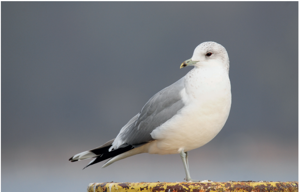
Abb. 4: Sturmmöwe, Altvogel, Caputh/PM, März 2016. Fig. 4: Mew Gull, ad., Larus canus .

Gebietsmax. ab 3 Ex., 1. Halbjahr: 7.Jan 5 Schwielowsee/PM (R.Schneider) * 7.-15.Jan 4 Dahme Grünau-Köpenick/B (R.Eidner) * 10.Jan 4 Pichelsdorfer Havel/B (K.Lüddecke) * 29.Jan 7 Oder Schwedt-Friedrichsthal/UM (WD). Heimzug, Letztbeob.: 17.Apr 1 Peitzer Teiche/SPN (H.-P.Krüger) * 23.Apr 1 Pfaueninsel/B (D.Ehlert). Wegzug, Erstbeob.: 2.Aug 1 immat. Lietzengraben/B (E.Hübner) * 18.Aug 1 ad. Elbe bei Wootz/PR (H.-W.Ullrich, T.Könning). Gebietsmax. ab 3 Ex., 2. Halbjahr: 8.Sep 3 SP Templiner See/P (S.Klasan) * 7.Nov 3 ebd. (S.Klasan) * 3.Dez 4 Müggelsee (K.Lüddecke) * 5.Dez 3 Schwielowsee/PM (E.Drutkowski) * 27.Dez 6 Unteres Odertal Schwedt-Friedrichsthal (WD) * 31.Dez 3 Tempelhofer Feld/B (C.Schwägerl).