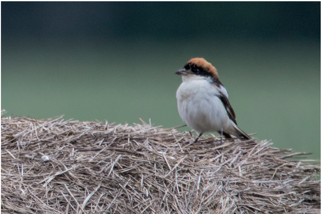
Abb. 10: Rotkopfwürger, Weibchen, Mögeln/HVL, Mai 2016. Fig. 10: Woodchat Shrike, female, Lanius senator .