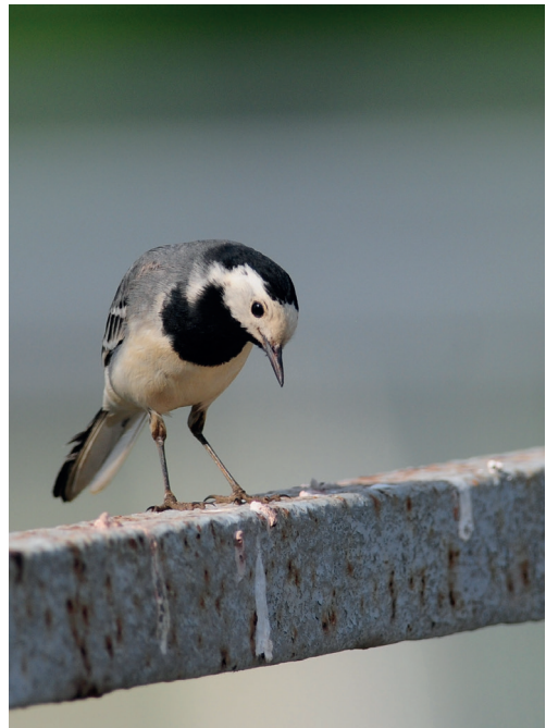
Abb. 15: Bachstelze, Kleinrössen/EE, Mai 2016.

Bergpieper Anthus spinoletta : im ersten Halbjahr 315 Ex. bei 42 Beob. und geringe Anzahl im zweiten Halbjahr , 158 Ex. bei 41 Beob. (bei Datenreihen Wertung der Monatsmax.). Gebietsmax. ab 10 Ex.: 6.Jan 16 Unteres Odertal Schwedt (DK) * 19.Jan 50, 17.Feb/1.Mär 45 und 12.Dez 20 Unteres Odertal Friedrichsthal (H.-J.Haferland; WD) * 19.Jan 24 und 11.Nov 10 Klärwerkableiter Schönerlinde/BAR (P.Pakull; A.Haman) * 6.Feb 42 Unteres Odertal Lunow-Stolpe (HH) * 6.Nov 23 Schlepziger Teiche (T.Noah) * 6.Nov 12 Gülper See (HH) * 21.Nov 11 Havelnied. Parey (B.Jahnke, S.Klasan). Heimzug, Letztbeob.: 11.Apr 5 Gülper See (M.Wink) und 1 Unteres Odertal Friedrichsthal (WD) * 14.Apr 1 Lietzengraben/B (C.Witte). Wegzug, Erstbeob.: 30.Sep/7.Okt 1 Unteres Odertal Criewen (DK) * 17.Okt 6 Unteres Odertal Friedrichsthal (WD).