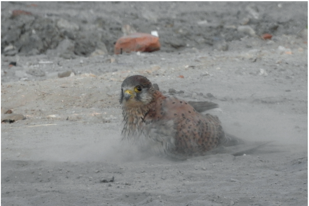
Abb. 9: Turmfalke beim Staubbaden, Potsdam/P, Juni 2016. Fig. 9: Common Kestrel, Falco tinnunculus .