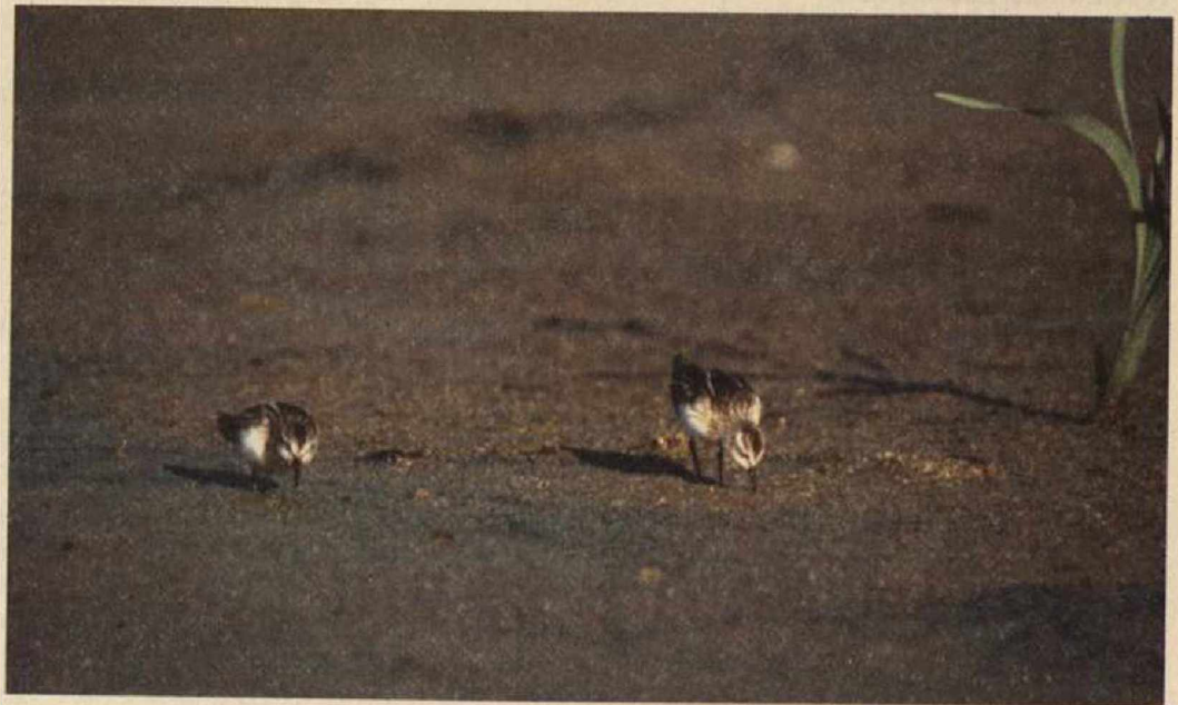
Abb. 1 (oben): Ausschnitt eines größeren Rastverbandes juveniler Zwergstrandläufer; September 1996; Stradowe Teiche/ OSL