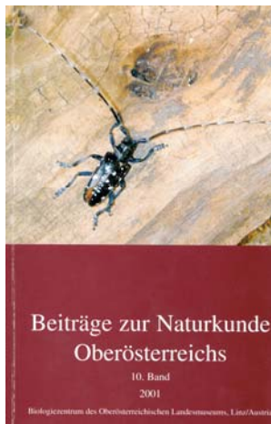
Beiträge zur Naturkunde Oberösterreichs, Bd. 10 , 573 pp., (58.-€)