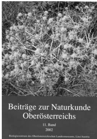
Beiträge zur Naturkunde Oberösterreichs, Bd. 11 (2002), 597 pp., (59.-€) Im Abo zum halben Preis!