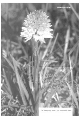
Linzer biol. Beiträge 34/2 , 839pp., (2002), (56 Euro)