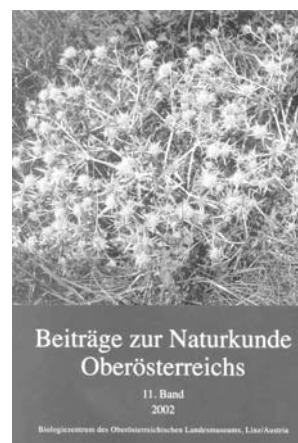
Beiträge zur Naturkunde Oberösterreichs 11 , 597pp., (2002), (59 Euro)