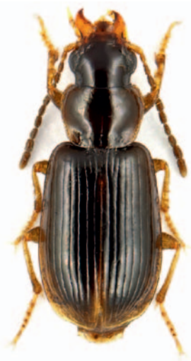
Abb. 2: Acupalpus exiguus .

Agonum gracile (Abb. 3) wird von einigen Autoren als Art mit Verbreitungsschwerpunkt in Hochmooren, Flachmooren und vegetationsreichen Ufern beschrieben (BARNER 1954, GERSDORF 1937, LINDROTH 1945, PEUS 1928, 1932). Die Affinität zu Lebensräumen mit dichten Sphagnum -Beständen heben dabei z.B. RABELER (1931) aber auch PEUS (1928, 1932) und BARNER (1954) hervor. Andere Autoren