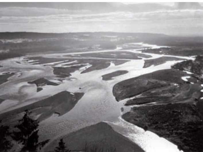
Isarauen bei Wolfratshausen 1949 mit weitläufigem Umlagerungsbereich (Foto: Prof. Otto Kraus, ANL-Archiv).