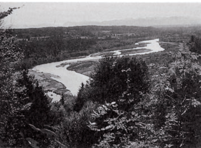
Kanalisiertes Flusslauf bei Wolfratshausen 1969 (Foto: ANL-Archiv).