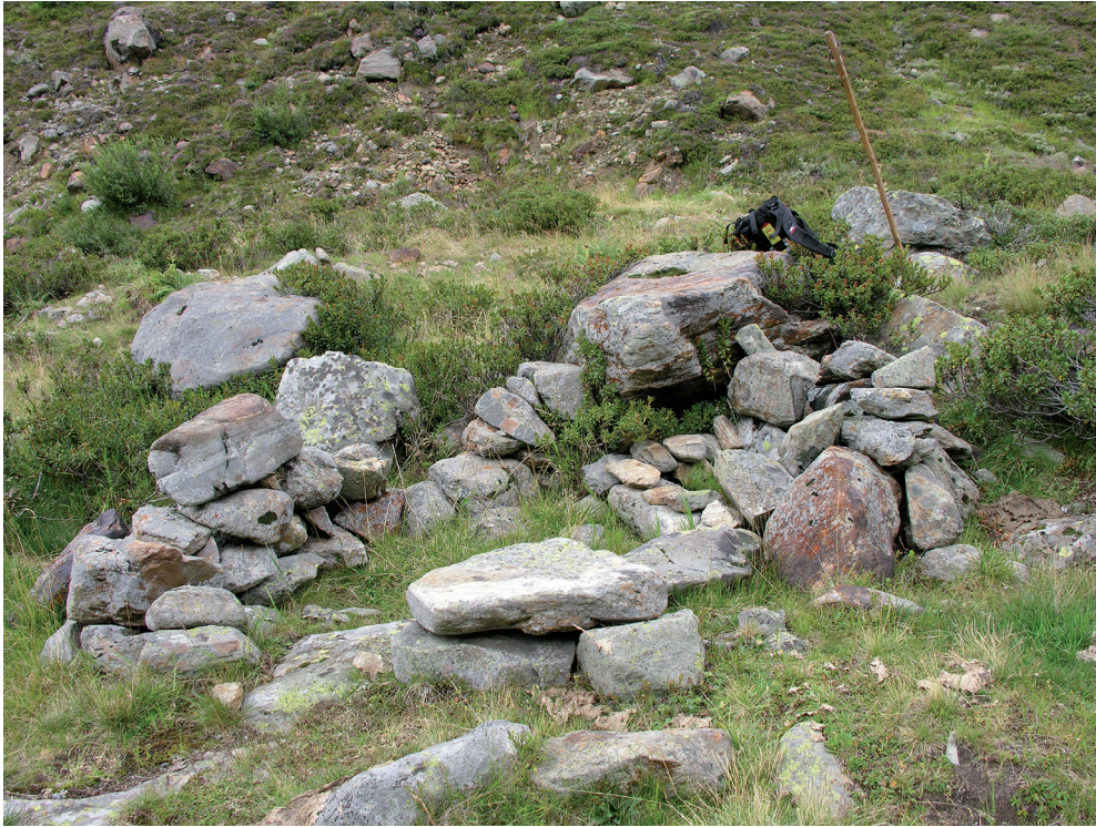
Abb. 8: Verfallener Hirtenunterstand aus Trockenmauern im Timmelstal