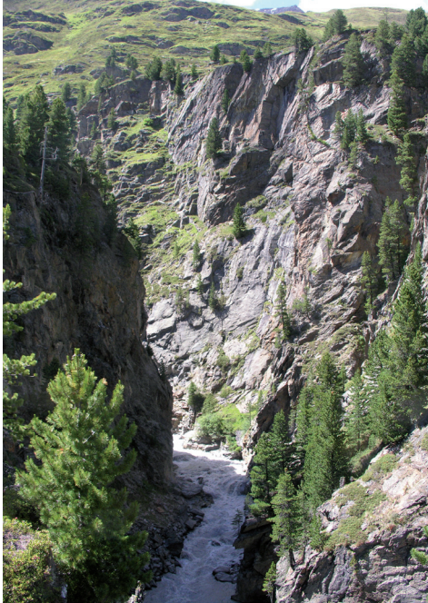
Abb. 3: Schlucht des Gurgler Baches beim Beilstein (oben an der Felskante rechts, ca. 100 m über dem Talboden), Blickrichtung W

diese Materialien selbst einen wichtigen Antrieb zur Wanderschaft (Crotti 2005). Mit Ausnahme von Bergkristall finden sie sich vorwiegend in den Kalk- und Juraformationen der Voralpen (Binsteiner 1994). Sie belegen einen Aktionsradius von hunderten Kilometern.