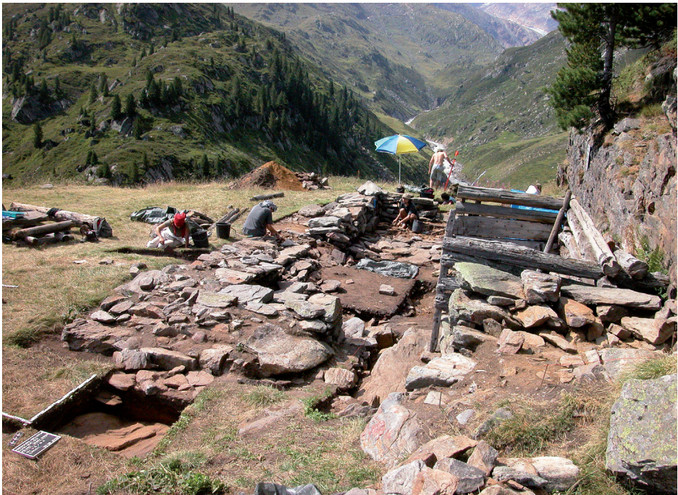
Abb. 2: Ausgrabungen bei der Almwüstung Beilstein, Blickrichtung S

ser Menschen vor allem an Idealrouten nahe der Waldgrenze zu und zwischen bevorzugten Jagd- und Sammelgebieten. Die häufigste Herkunft des Rohmaterials der Artefakte in Vent spricht beispielsweise für eine Erschließung des inneren Ötztals aus Richtung Süden (Leitner 1999) 5 . Vermutlich hängt das mit den günstigeren klimatischen Bedingungen südlich des Alpenhauptkamms zusammen, aber auch mit dem dort anstehenden, qualitativollen Silex (z. B. im Nonstal, Monte Baldo, Lessinische Alpen). Nicht zuletzt gaben