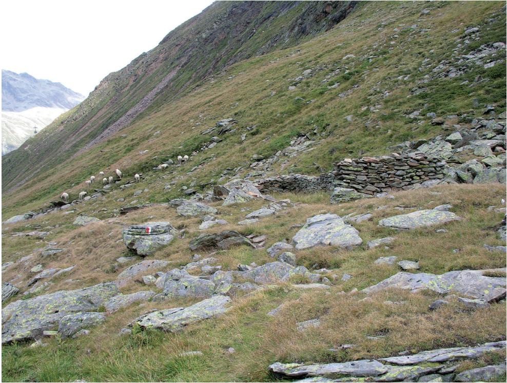
Abb. 7: Verfallene Hütte (Stall?) im Königstal

den Schultern, besonders jener über Am Beil-Kuppele-Putzach, der im Talgrund auf den Gurgler Ferner trifft. Je nach Ankunftsrichtung und Ziel ist dieser Pfad oder jener an der gegenüberliegenden Talseite über die Gurgler Alm-Kleinalpl günstiger, um den Ferner zu erreichen. Hier konnte auf die jeweils andere Talseite übergewechselt werden. Dazu mochten auch den Gurgler Bach überspannende Lawinenkegel dienen, die den Sommer über liegen bleiben.