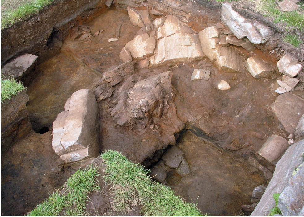
Abb. 4: Mesolithische Befunde am Beilstein, halbkreisförmige Steinsetzung inmitten von Kulturschichten

natürlich ein enger Zusammenhang zwischen Jagdtechnik und Ergologie der Jagdgeräte.