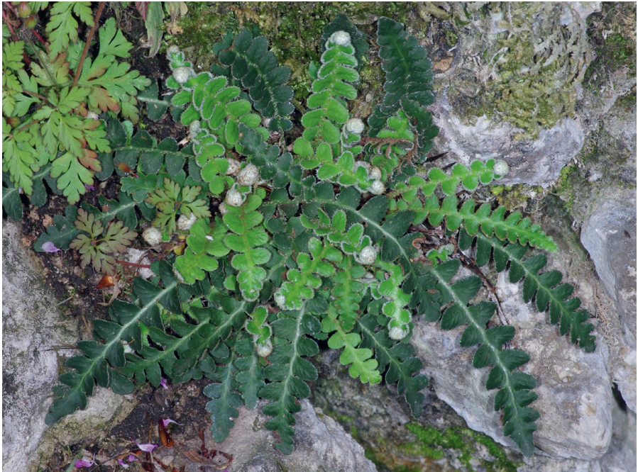
Abb. 1: Asplenium ceterach am neu entdeckten Wuchsort bei Tiefenellern

Der Milzfarn (auch Schriftfarn) ist eine kleine Farnart, deren Blätter kaum länger als 10 cm werden. Durch seine lederartigen Blätter, die sich bei Trockenheit einrollen und unterseits dicht mit Spreuschuppen bedeckt sind, ist er aber leicht zu erkennen (Abb. 1). Früher wurde er in einer eigenen Gattung als Ceterach officinarum Willd. geführt. Die heutige Einbeziehung in die weltweit größte FarnGattung Asplenium scheint nach neuesten Erkenntnissen gerechtfertigt zu sein (XU et al. 2020).