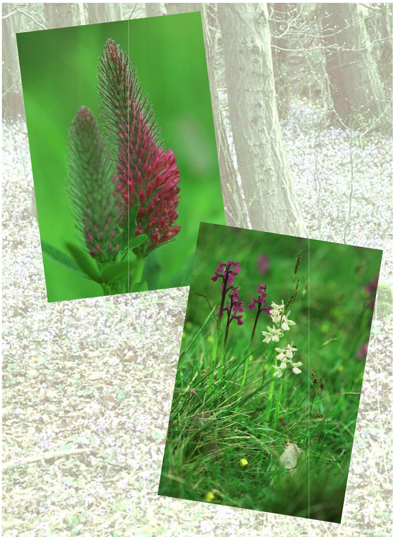
Purpur-Klee ( Trifolium rubens ), Kollerberg bei Berolzheim, Juni 2001 (oben)