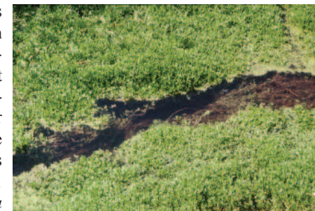
Abb. 2: Nur eine schmale Rinne bleibt im Montia -Teppich noch offen.

In der Roten Liste gefährdeter Gefäßpflanzen Bayerns (SCHEUERER & AHLMER 2002) gilt für Montia fontana subsp. variabilis die Gefährdungsstufe 3 für ganz Bayern, 2 für das Keuper-Lias-Land und das Ostbayerische Grundgebirge, V für die Region Spessart-Rhön.