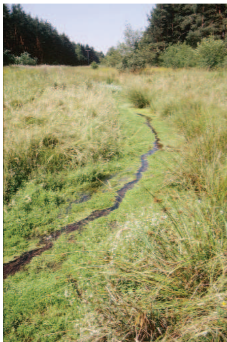
Abb. 1: Blick in das Finsterbachtal, talabwärts. Seitlicher Zufluss mit Montia fontana subsp. variabilis . Der Finsterbach selbst fließt auf der linken Talseite.

Die Datenlage für die Vertreter der Gattung Montia im Regnitzgebiet präsentiert sich nicht als sehr aufschlussreich (vgl. GATTERER & NEZADAL 2003: 215). Zwar sind im Gesamtverzeichnis aller Informationen über die Gattung Montia im Regnitzgebiet (Datenbestand: Verein zur Erforschung