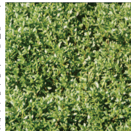
Abb. 3: Die subsp. variabilis in voller Entwicklung.