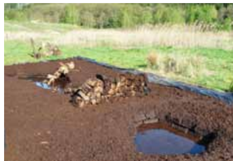
Abb. 8: Frisch angelegtes Hochmoor-Beet im Landschaftspark von Schloss Dennenlohe für weitere Erhaltungskulturen in größerem Maßstab.