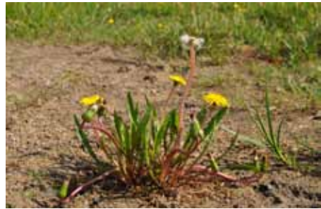
Abb 7: Blühender Doppelzähliger Löwenzahn ( Taraxacum geminidentatum ) ein Jahr nach der Auspflanzung. Foto: A. Kerskes, Mai 2012