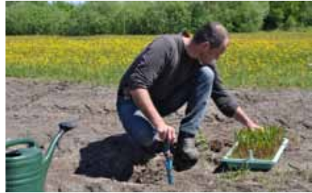
Abb 6: Auspflanzen nachgezogener Exemplare des Doppelzähligen Löwenzahns ( Taraxacum geminidentatum ) auf zuvor speziell präparierten Flächen am Wildstandort als populationsstützende Maßnahme. Foto: A. Kerskes, Mai 2011

Der Botanische Garten Erlangen wird sich trotz des geringen Raumangebotes und begrenzter personeller Ressourcen auch weiterhin an Maßnahmen beteiligen, die helfen sollen, die pflanzliche Vielfalt unserer Heimat zu erhalten.