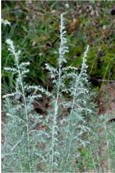
Abb. 1: Der Österreichische Beifuß ( Artemisia austriaca) von einem seit über 300 Jahren belegten Fundort bei Nürnberg befindet sich seit Jahrzehnten in Erlangen in einer Erhaltungskultur.

bayern- oder sogar deutschlandweit ihre letzten Wuchsorte in Mittelfranken. Daneben werden mit den seltenen endemischen Mehlbeeren-Arten ( Sorbus spp.) der Frankenalb (Abb. 3) Arten kultiviert, die weltweit nur hier vorkommen.