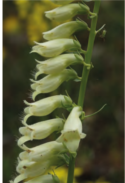
Abb. 2: Digitalis lutea am Görauer Anger