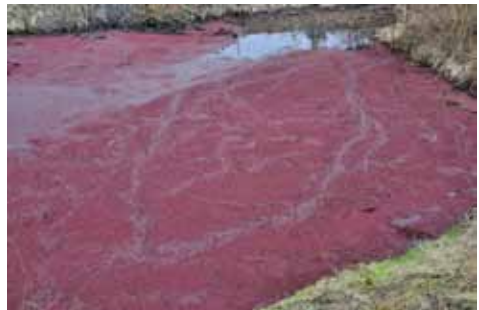
Abb. 1-2: Den Winter 2014/2015 hat Azolla filiculoides vital überdauert und bildet in einigen Fischteichen Anfang März dichte, rot gefärbte Matten.