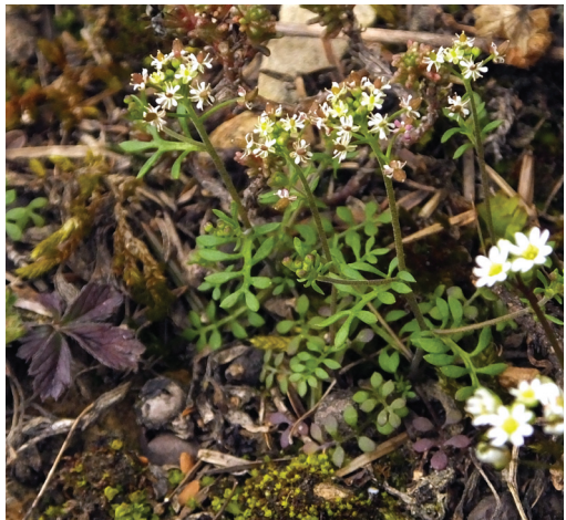
Abb. 2: Hornungia petraea

felsdurchsetzten Kalkmagerrasenhängen bei Neuhaus a. d. Aufseß war Draba aizoides jetzt in Hochblüte. Aufgefallen waren mir sofort an einem reichbesetzten Standort grünlich-weiße, rasige Polster auf den Felsköpfen und -bändern sowie in den mit Rohhumus angereicherten Felsrinnen. Aus der Nähe betrachtet war es ein kleiner etwa 3 cm hoher, unscheinbarer Kreuzblütler, der eng mit Erophila verna subsp. verna vergesellschaftet vorkam und nur bei näherer Betrachtung zu unterscheiden war (Abb. 2). Ein mitgeführtes Bestimmungsbuch brachte mich, die historische Angabe im Kopf, schnell zu Hornungia petraea . Doch eine