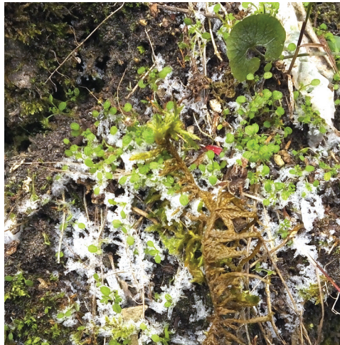
Abb. 6: Hornungia petraea -Keimlinge, mit Draba aizoides -Jungpflanze im Schnee

Am 15.5.2016 besuchte ich den Standort erneut, um einen Einblick in die Weiterentwicklung und Auffindbarkeit der Pflanzen zu gewinnen. Sie befanden sich alle im fruchtenden Zustand, der Samenansatz war reichlich, etwa 10 – 30 orangefarbene Samen pro Pflanze (Abb. 4 und 5). Sie hatten sich überwiegend rotbraun bis grünlichbraun verfärbt und waren deshalb leicht in der jetzt höher werdenden Begleitvegetation zu entdecken. Bei der Biotopbegehung am 16.8.2016 war von den Pflanzen nichts mehr zu sehen. Der Fundort war in Teilflächen abgezaunt und wurde extensiv mit wenigen Schafen beweidet, die dadurch geschaffenen offenen Flächen waren allerdings fast vegetationslos.