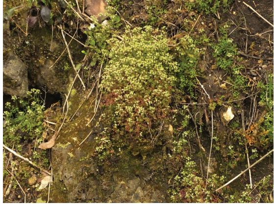
Abb. 3: Hornungia petraea , rasig wachsend, Anfang April blühend Foto: Lang, 3.4.16

gewisse Unsicherheit wegen des überraschenden Fundes und des massenhaften Vorkommens war geblieben. Unverzüglich setzte ich unseren 1. Vorsitzenden Johannes Wagenknecht davon in Kenntnis und bereits am 5. April 2016 begingen wir den Fundort und konnten gemeinsam das Vorkommen nochmals bestätigen. Bei der Anzahl der Pflanzen hatten wir uns beide auf eine Größenordnung von mehreren Tausend geeinigt, am Fundtag hatte ich im Tagebuch ca. 5000 Exemplare vermerkt. Durch die Unübersichtlichkeit