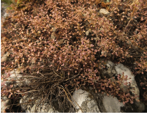
Abb. 4: Gruppe von Hornungia petraea , fruchtend, anthozyanhaltig