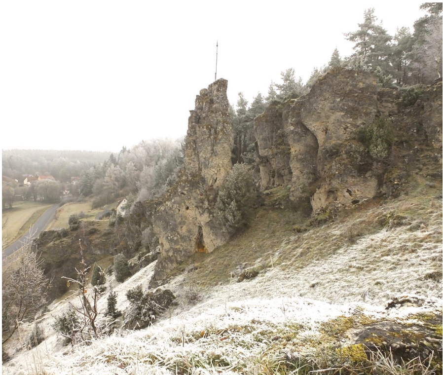
Abb. 8: Der raureiffreie Bereich ist der Wuchsortbereich von Hornungia petraea Foto: Lang, 7.12.16

Die Fragmentierung von Lebensräumen und Populationen wird für eine Reihe von Tier- und Pflanzenarten als wesentliche Ursache des Rückganges bzw. des lokalen Aussterbens angesehen. Dabei muss unterschieden werden zwischen anthropogener Fragmentierung, deren starke Zunahme sich vor allem für die letzten 50 Jahre belegen lässt, und natürlicher Fragmentierung. Kleine Populationen zeigen dadurch auch eine verminderte genetische Variabilität und geringere reproduktive Fitness.