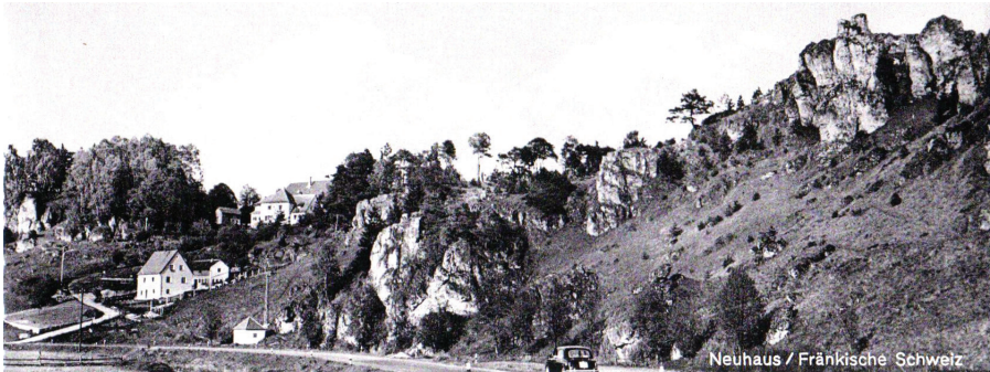
Abb. 1: Neuhaus, Biotop um 1950