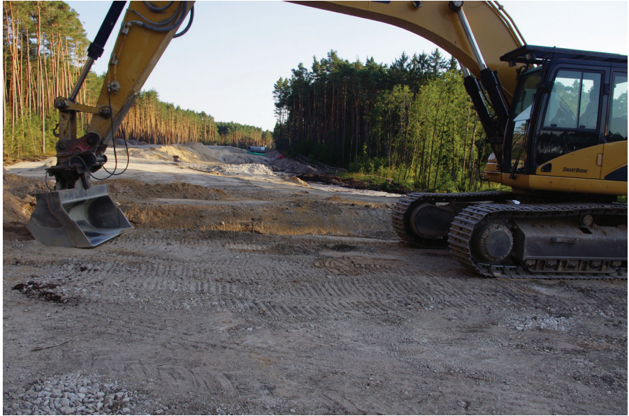
Abb. 11: Das Bild mit Blick nach Süden vermittelt einen Eindruck vom Flächenverbrauch dieser neuen Straßentrasse. Rechts hinter dem Bagger die hellgrünen Erlen des Feuchtgebiets. Hinter der Baggerschaufel beginnt der Graben des Löchlbrunnens, nun weitgehend schon verhüllt mit Schotter.