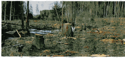
Um dieses Feuchtgebiet sorgen sich Naturschützer.