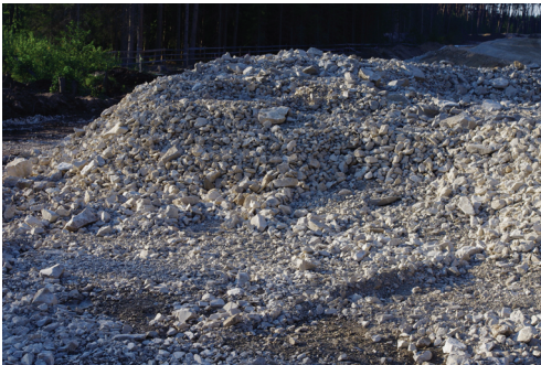
Abb. 9: Grobschotter, der unter der neuen Straßentrasse den Wasserdurchfluss sicherstellen soll. Nach Ansicht von Tiefbau-Fachleuten handelt es sich um eine heute übliche Maßnahme.

Wie Abb. 11 zeigt, sind die Eingriffe in die Landschaft gewaltig. Verglichen mit der neuen Trasse der B 299 ist der Ludwigs-Kanal, der vor 150 Jahren gebaut wurde und nun parallel zur neuen Straße verläuft, nur ein schmales Gräblein. Der Begriff „Gigantomanie“ drängt sich auf angesichts der Erdbewegungen, Brückenbauten und Straßentrassen samt ihren Zu- und Ableitungen.