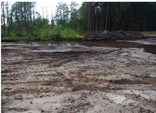
Abb. 7: Nachdem die Flugsande (hier nur noch wenig vermischt mit Terrassensanden) abgetragen waren, zeigte sich der von der ostwärtigen Bergseite heranziehende und nun offengelegte Bachverlauf des Löchlbrunn sehr deutlich. Rechts im Bild vor den Kiefern sind die abgeschobenen Sand/Torf-Gemische gut zu sehen. Der Wasserlauf stellte die verantwortlichen Bauleute an der Baustelle vor einige Probleme.

Die Abbildungen 7 und 8 zeigen den unter dem abgeräumten Sand hervortretenden Wasserlauf samt einem Teil der randlich aufgeschobenen Torfe. Ohne Frage galt es nun, den weiteren Zulauf für den Löchlbrunn sicherzustellen. Das sollte mittels eines eingebrach-