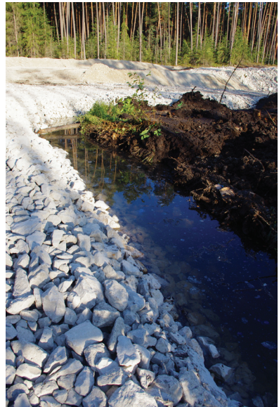
Abb. 10 (rechts): Das Grobschotter-Bett ist bereits bis an den Rand des Löchlbrunns angelegt.