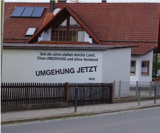
Abb. 4: Protestplakat an einer Hausmauer neben der B 299 in Mühlhausen

Im Frühjahr 2017 begannen auf der Trasse umfangreiche Rodungsarbeiten, die auch unmittelbar an das Feuchtgebiet Rehau mit dem Löchlbrunn heranreichten (Abb. 5). In einem Pressebeitrag brachte der VFR seine Befürchtungen über eine zerstörerische Beeinflussung dieser Gebiete zum Ausdruck (Neumarkter Tagblatt v. 16.3.2017, Abb. 6). Gleichzeitig richtete der VFR nochmals ein Schreiben an das Staatl. Bauamt Regensburg und erinnerte an die Versprechen der Planer von 2011. Am 8. Mai 2017 kam mit zwei Vertretern des Staatl. Bauamts Regensburg und den Vereinsmitgliedern Fürnrohr,