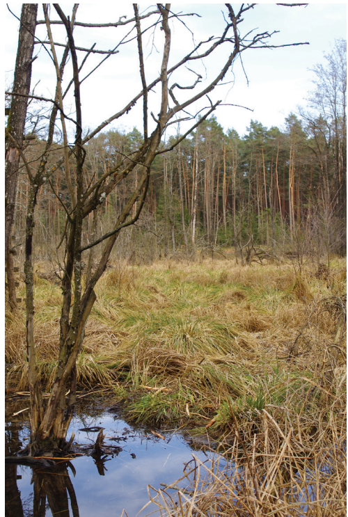
Abb. 1: Löchlbrunn in der Rehau, Frühjahrs-Aspekt

Die Sulz und ihre Zuflüsse Lach und Wiefelsbach haben ihren Ursprung jedoch schon außerhalb der hydrologisch etwas verworrenen Talwasserscheide von Neumarkt und lenken ihr Wasser der Altmühl zu, ohne die Schwelle zwischen Stauer Berg und