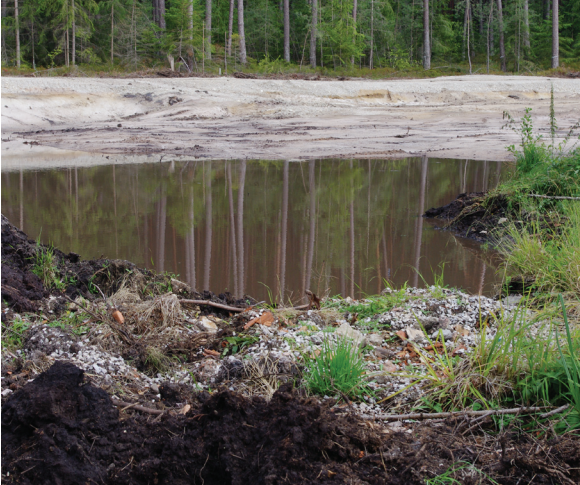
Abb. 8: Vom Löchlbrunn aus fällt der Blick nach Osten auf die freigelegten Sande. Im Vordergrund links aufgetürmte Torfmassen aus dem fossilen Bachbett, rechts die ersten Gras- und Seggenbestände.