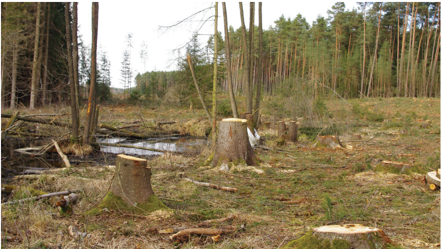
Abb. 5: Die Rodungen für die neue Straßentrasse reichen unmittelbar an die ersten Wasseraustritte des Löchlbrunns heran. Dieser Zustand im Frühjahr 2017 hat den VFR veranlasst, sich erneut an das Staatliche Bauamt Regensburg zu wenden.