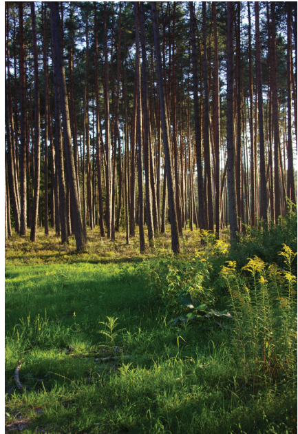
Abb. 2: Ähnlich wie in benachbarten Sandgebieten (z. B. Nürnberger Reichswald, Altdorfer Flugsande) prägen Kiefern ( Pinus sylvestris) die weitläufigen Wälder östlich von Mühlhausen.

Vor allem der Löchlbrunn ist ein stark verumpfter Bereich mit einzelnen kleinen Tümpeln, Wasserlöchern und einem sehr langsam fließenden, stark gewundenen Wasserlauf gleichen Namens. Die historische Flurkarte lässt erkennen, dass dieser Feucht-