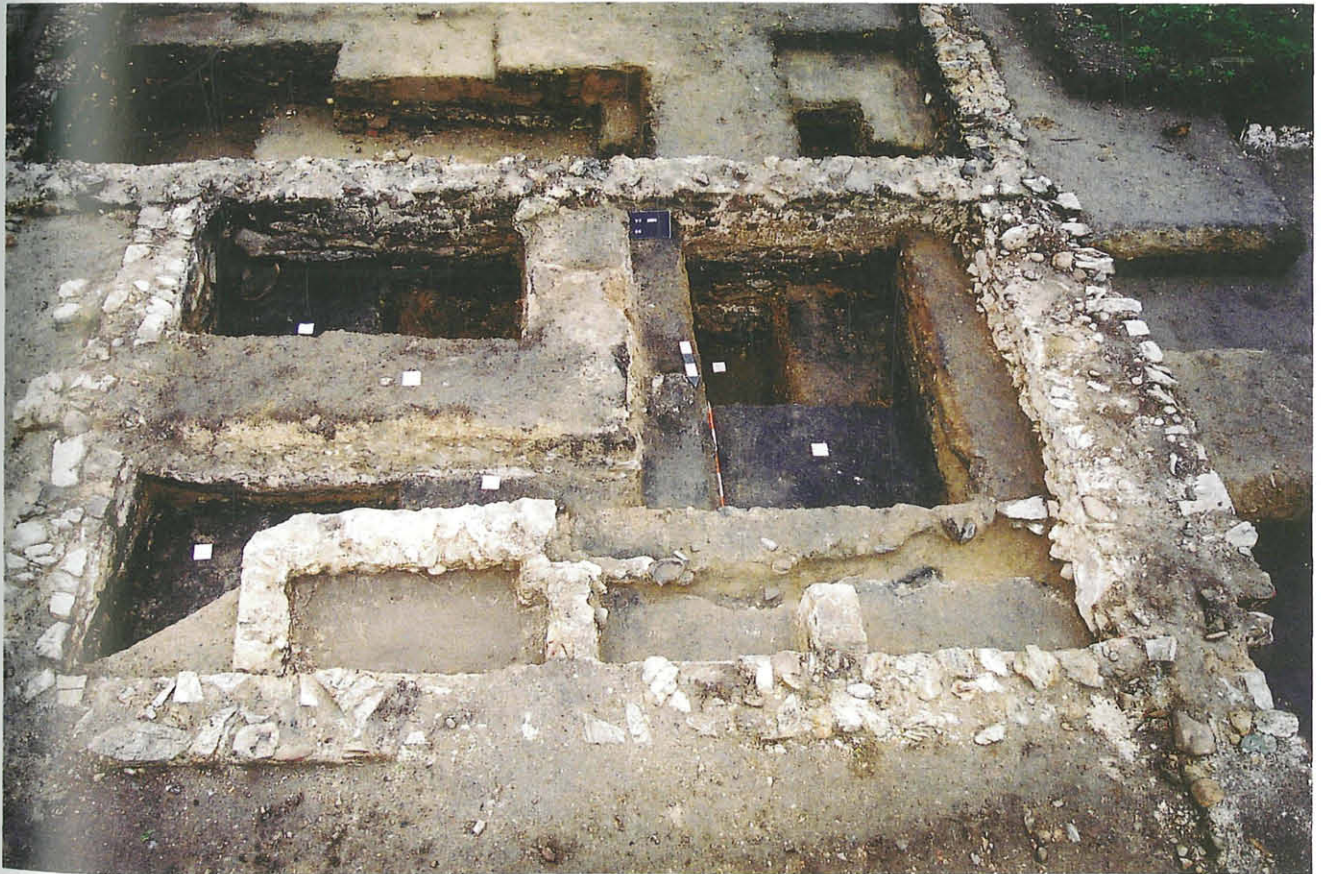
Abb. 3: Walkerei (Raum II). Blick nach Norden.

Nicht vor Beginn des dritten Jahrhunderts erfolgt neuerlich ein Eingriff in die Baustruktur dieses textilverarbeitenden Betriebes. Der sich 17 m in West-Ost- und 7 m in Nord-Süd-Richtung erstreckende Arbeitsbereich der fullonica (Räume II, III, X, XXVI–XXVIII) wird in Bauperiode V durch den Bau der Mauern M4, 8, 11, 12 und 15 tiefgreifend verändert. So entsteht nun östlich des mit einem Mörtelstrich versiegelten Raumes II der hypokaustierte Raum X, dessen Bodenniveau etwa 0,3–0,5 m über der heutigen Ackeroberfläche gelegen haben musste. Die Befuerung erfolgte aus dem Praefurnium IVA, welches wohl aus einem Hof (IV, XIV und XV) zu beschicken war. Wenngleich Raum XVI in seiner Nutzung als Wohnraum erhalten blieb, erinnern die Räume III und II/X an übliche Tabernen. Den südlich der M2 gelegenen Raum I, gleichermaßen aber den Bereich östlich der Mauer M3 bis hin zur M10 bedeckte ein brauner unebener Lehm-schlag, welcher in diesem Areal vermutlich ebenfalls einen Hofbereich erkennen lassen wird.