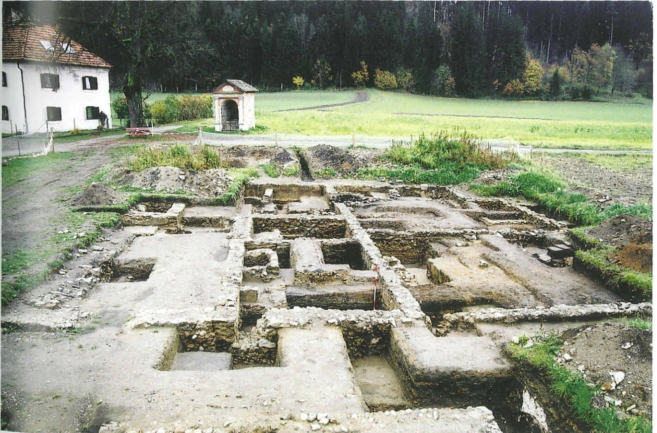
Abb. 1: Grabungsfläche im Überblick aus Westen.

Die M2 trennt dabei zwei nicht direkt miteinander verbundene gleichartige Werkstätten. In beiden Bereichen zeugen Reste demolierter Beckenstrukturen (L1 und L3) von einer möglichen Nutzung als textilverarbeitender Betrieb, vorzugsweise als Walkerei/fullonica. Die Räumlichkeit XXVI im Nordosten war mit einem wasserfesten opus signinum-Boden ausgekleidet, wies