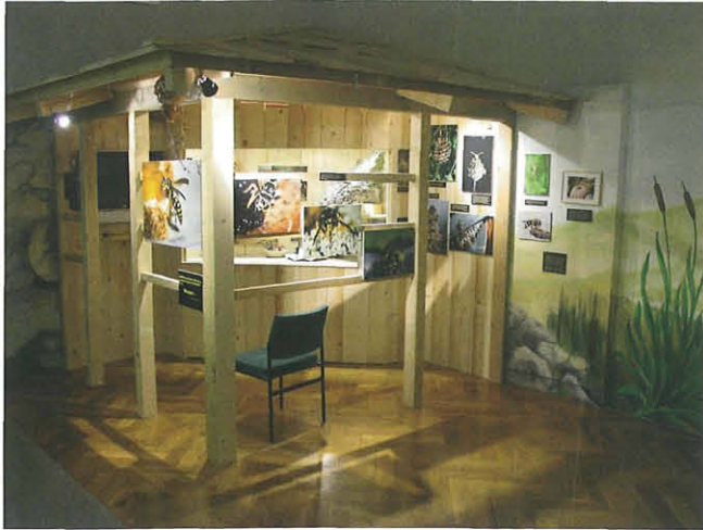
Abb. 1: Präsentation der Wespen- und Hornissennester bei der Wespen-Ausstellung.

Ebenso mussten die Illustrationen befestigt bzw. die mediale Unterstützung (Präsentationsbildschirm) installiert werden. Die wissenschaftliche Betreuung oblag Dr. Christian Wieser.