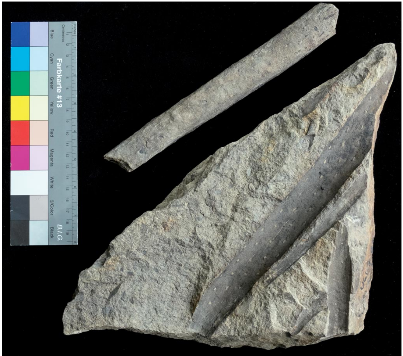
Abb. 2: Stammstück und Abdruck von Pleuromeia sternbergii vom Ulrichsberg in Kärnten (leg. H. Kabon, Ulr. 1-2A).

Zugang Phanerogamen 2017: 1860 Belege. Inventarnummern Endstand: BP 183518. Zugang Kryptogamen 2017: 833 Belege. Inventarnummern Endstand: BK 60382.