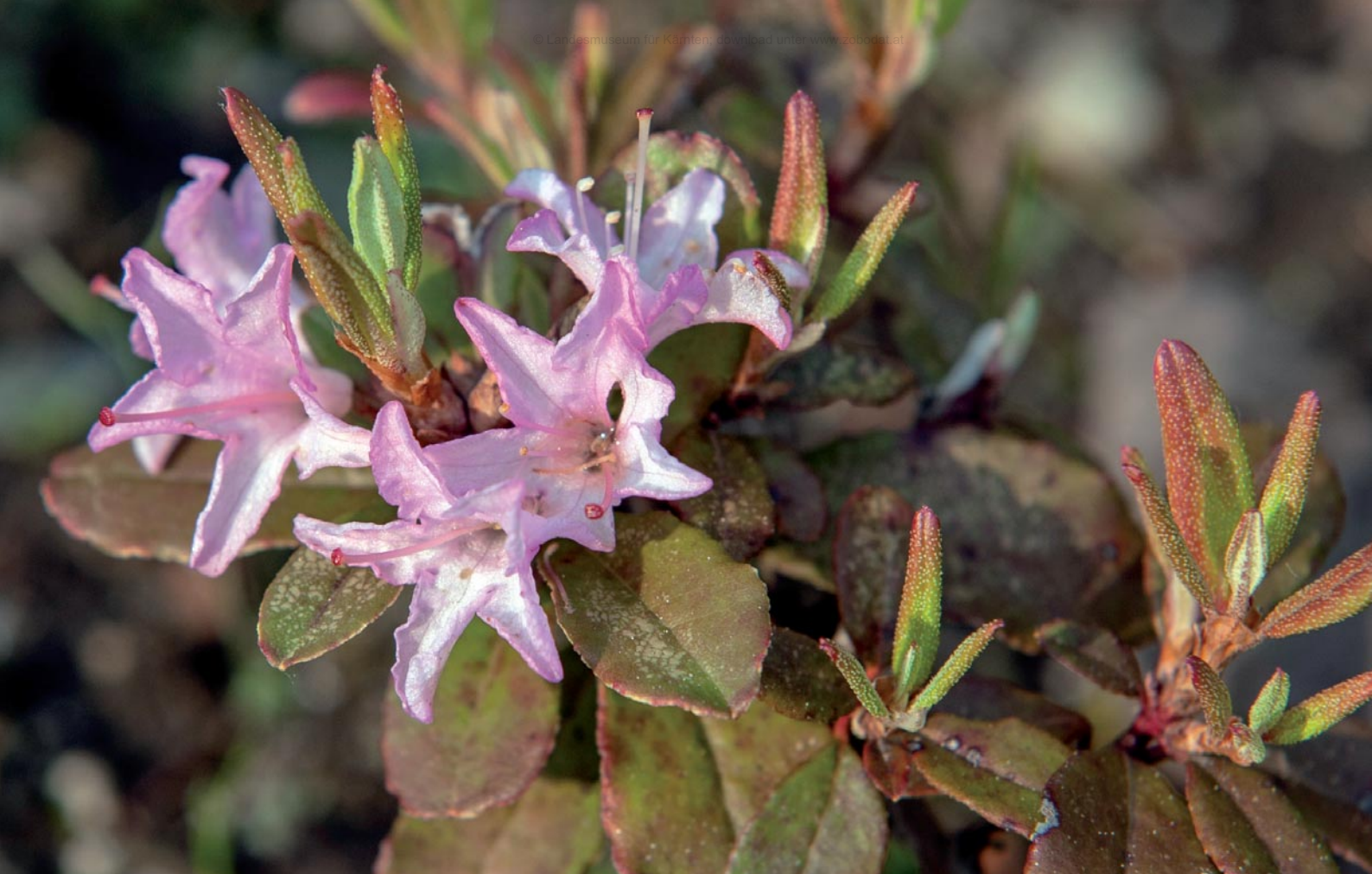
Abb. 4: Rhododendron racemosum aus dem südlichen China blüht im Rhododendronquartier des Botanischen Gartens in Klagenfurt.

sämtliche Beet-Terrassen. Die Beton-Umrandung des Hauptwegs durch den Bauerngarten wurde neu gemauert und etwas erhöht, sodass auch ein neuer Belag aus feinem Grünschiefersand aufgebracht werden konnte. Problematisch entwickelte sich in den letzten Jahren der Zustand der Beschriftung für Personen mit eingeschränkter Sehkraft mit Tafeln in Brailleschrift. Obwohl wir ursprünglich wetterfeste Balken aus kesseldruck-imprägniertem Holz verwendeten, traten schon nach wenigen Jahren massiver Pilzbefall, Fäulnis und Rissbildung auf. Beschriftungstafeln begannen sich abzulösen und die Gefahr von Verletzungen durch Holzsplitter war zu groß. Aus diesem Grund mussten wir die Holzbalken tauschen. Dieselbe Type von Kunststoffbrettern, die bei der Terrassierung der Beete verwendet wurde, kam nun auch als Unterlage für die Tafeln in Braille-Schrift zum Einsatz. Anfängliche Probleme, die durch die enorme Längsdehnung