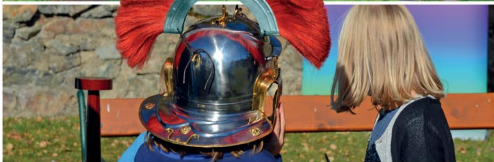
ARCHÄOLOGISCHER PARK MAGDALENSBERG