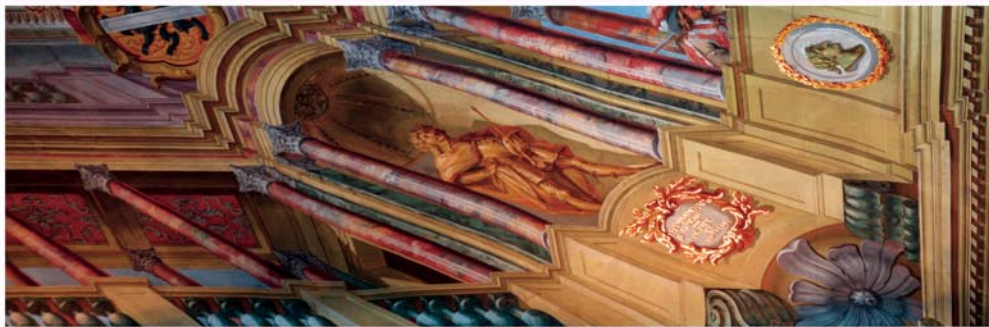
WAPPENSAAL IM LANDHAUS KLAGENFURT