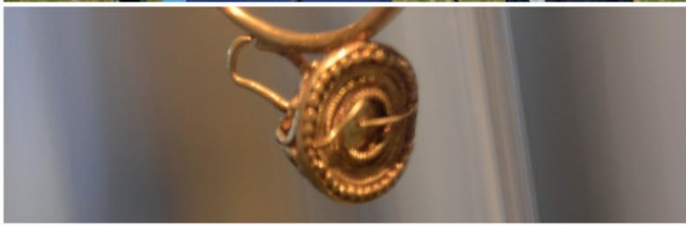
RÖMER- MUSEUM TEURNIA