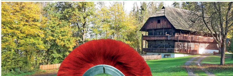
KÄRNTNER FREILICHT- MUSEUM MARIA SAAL