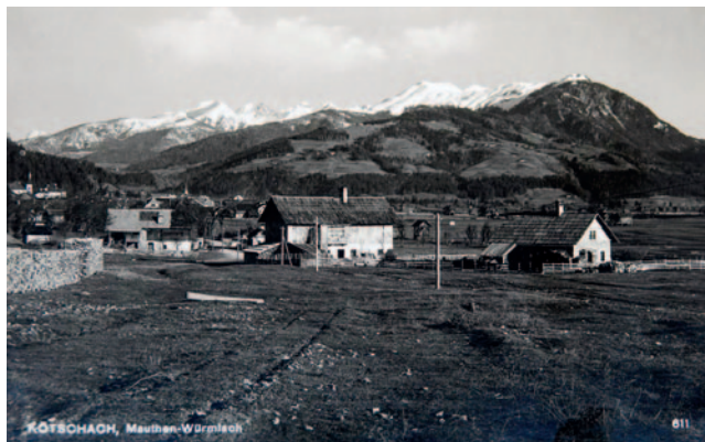
Abb. 2: Fotopostkarte in schwarz-weiß mit Blick auf Kötschach-Mauthen, 1926 (LG-Ansicht-3590).

LG-B/Pl.-690 gerahmtes Bild, Darstellung Alter Platz Klagenfurt, Rückseite: Ansichten aus Klagenfurt nach der Natur gezeichnet von Ludwig Schuller herausgegeben von Joseph Wagner 1843, Überreicht durch den Bürgermeister der Landeshauptstadt Klagenfurt Leopold Guggenberger mit persönlicher Widmung 12. April 1991