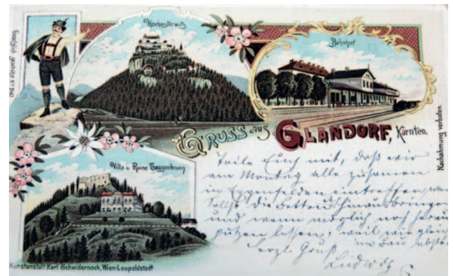
Abb. 3: Correspondenzkarte aus Glandorf mit diversen Sehenswürdigkeiten um 1890 (LG-Ansicht-3631).

LG-Ansicht-3560 bis LG-Ansicht-3636 div. Ansichtskarten mit