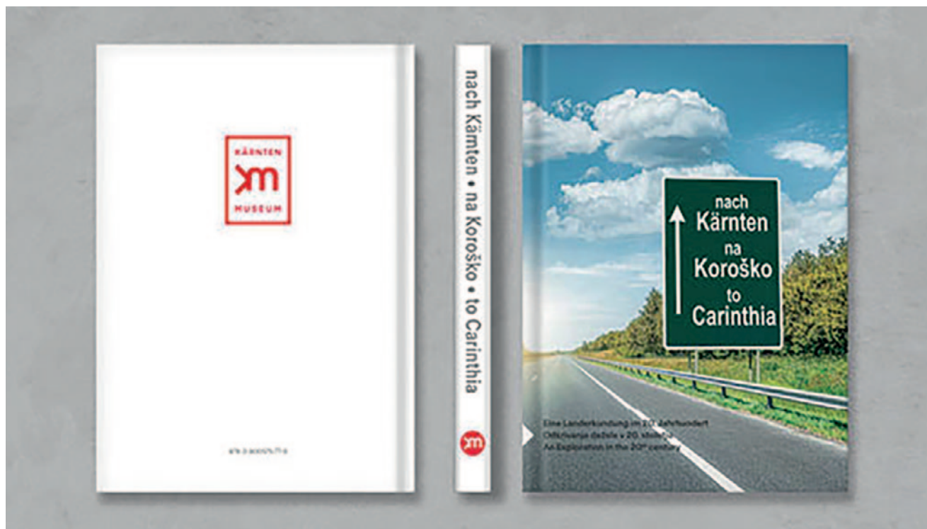
Abb. 6: Stermitz Martin (Red.), NACH KÄRNTEN | NA KOROŠKO | TO CARINTHIA. Eine Landerkundung im 20. Jahrhundert | Odkrivanje dežele v 20. stoletju | An Exploration in the 20th century. (Klagenfurt am Wörthersee 2022). © km

Ders., Jahresbericht der Abteilung Landesgeschichte, mittelalterliche und neuzeitliche Numismatik, In: Wieser Christian (Hg.), Rudolfinum. Jahrbuch des Landesmuseums für Kärnten 2021. S. 142–152. (Klagenfurt 2022).