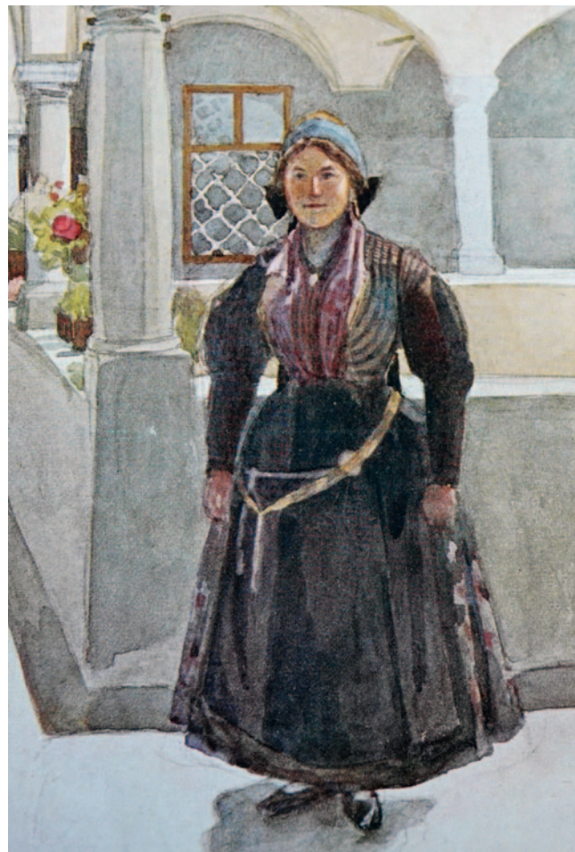
Abb. 5: Künstler Ansichtskarte, Kärntner Volkstrachten – Rosental von Leopold Resch, ohne Datum (LG-Ansicht-3598).

Motiven aus Kärnten und Motiven von verschiedenen Kärntner Trachten, 77 Stück