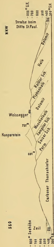
Höhen und Längen 1:25.000 nat. Gr.