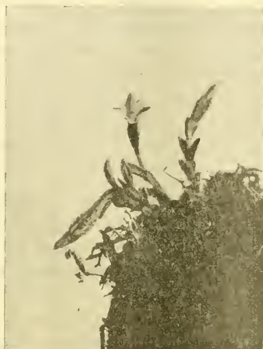
Fig. 1 a).

und schließlich hinein in die Röhre. Kaum war es darinnen, da begann auch schon die Blumenkrone sich zu schließen. Nach kaum einer halben Minute hatte die früher weit geöffnete Blüte das Aussehen einer Knospe, während alle anderen in der Umgebung stehenden Blüten unverändert geblieben waren. Es handelte sich offenbar um eine Bewegung auf Berührungsreiz. Ich versuchte nun gleich die empfindliche Stelle festzustellen und berührte eine größere Anzahl von Blüten mit einem feinen Grashalm an verschiedenen Punkten