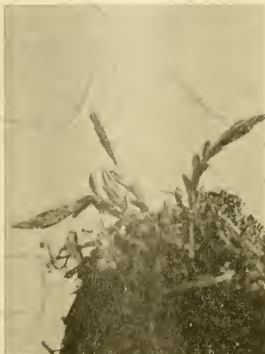
Fig. 1 b ).

Petalenhauptzipfel hinschoben. Stets begann die Bewegung an jener Stelle, wo die Blumenkrone berührt worden war; von dort pflanzte sich die Erregung dann zu den anderen Bewegungsstellen fort. Das Schema, Fig. 2, a bis d , möge den Vorgang erläutern. Es entspricht insofern nicht der Wirklichkeit, als im Endstadium die Hauptpetalenzipfel tatsächlich etwas eingerollt erscheinen, was in der Abbildung der Klarheit halber nicht berücksichtigt ist. Fig. 2 a bis d stellen aufeinanderfolgende