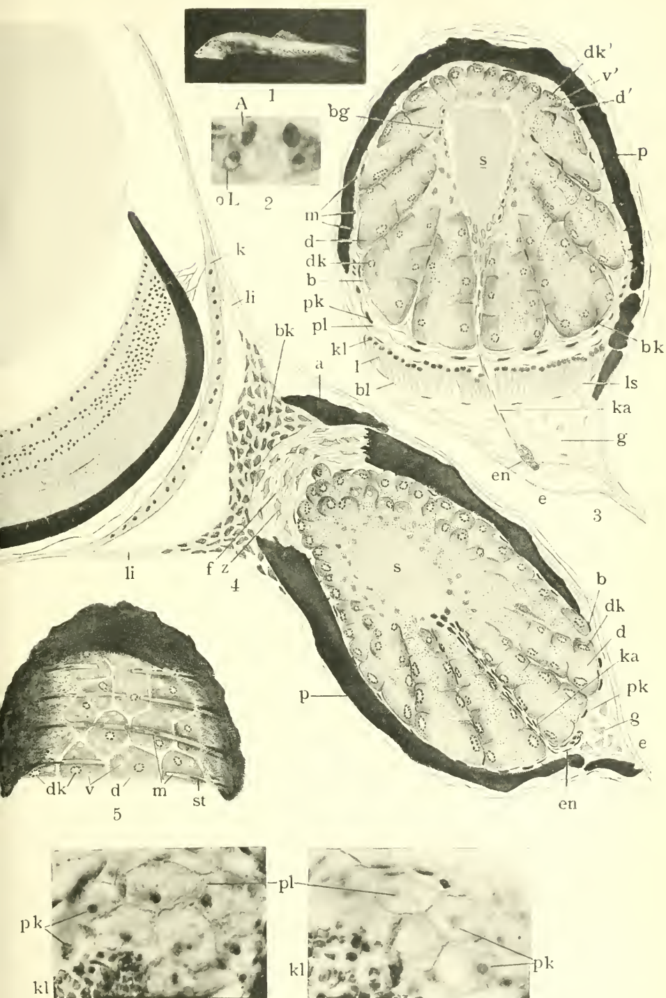
Trojan gez. u. phot. 6