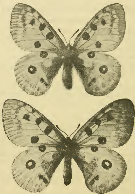
Fig. 1 und 2. Parnassius apollo (L.) dardanus Rbl.

Die Größe ist, namentlich beim ♂, eine geringe (Vorderflügelänge ♂ 40, ♀ 43, Exp. ♂ 66, ♀ 70 bis 75 mm). Die Flügelform ist kurz, nicht gestreckt. Die Grundfarbe der Flügel ist weiß, mit einem schwachen Stich ins Gelbliche, namentlich längs des Saumes der Hinterflügel. Eine schwarze Bestäubung der inneren Flügelfläche fehlt beim ♂ vollständig oder ist auf