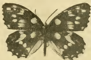
Fig. 3. Melanargia galatea (L.) procida Herbst ab. epanops Rbl.