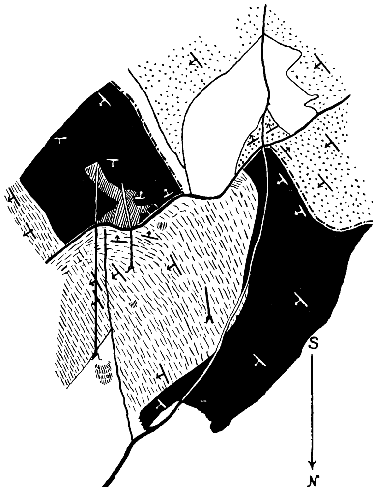
Fig. 1. Geologische Karte der Umgebung des Bergbaues Rotgülden. Von Dr. Th. Ohnesorge. Zeichen: gepunktet: Zentralgneise (des Hafners); gestrichelt: Schiefer der Silbereckscholle; schwarz: deren Marmore; weiß: Bergstürze, Moränen usw.; geschrafft: Lagerstätte.

deckt. Wir entnehmen ihr: In der Bachschlucht nahe dem Bau läßt sich eine Störung gut verfolgen. Sie verläuft hier zwischen Kalk und Gneisen, in der Mitte der Geländestufe zwischen Schiefer und Kalkglimmerschiefer. Sie streicht etwa ONO bei etwa 45^\circ SSO Fallen (siehe Karte, Fig. 1). Die Lagerstätte selbst hat in dem im