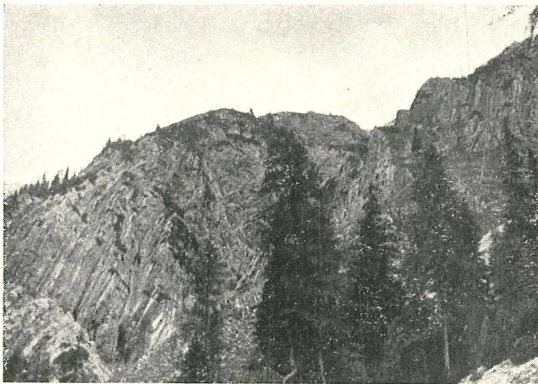
Fig. 2. Steile Falten im Süden der Weittalspitze.