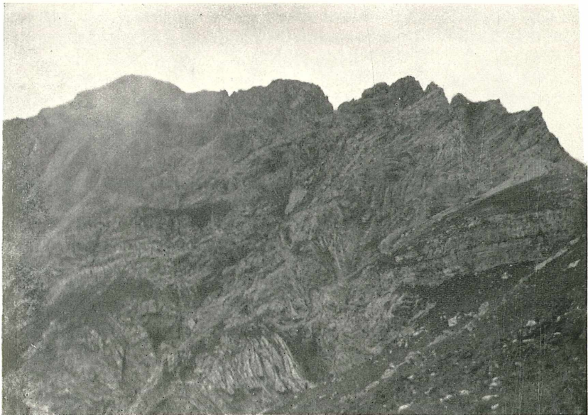
Fig. 2. Falten am Zochenpaß und an der Weittalspitze.