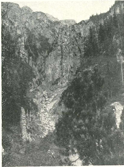
Fig. 1. Steilgestellte Raibler Schichten am Südabhang der Weittalspitze