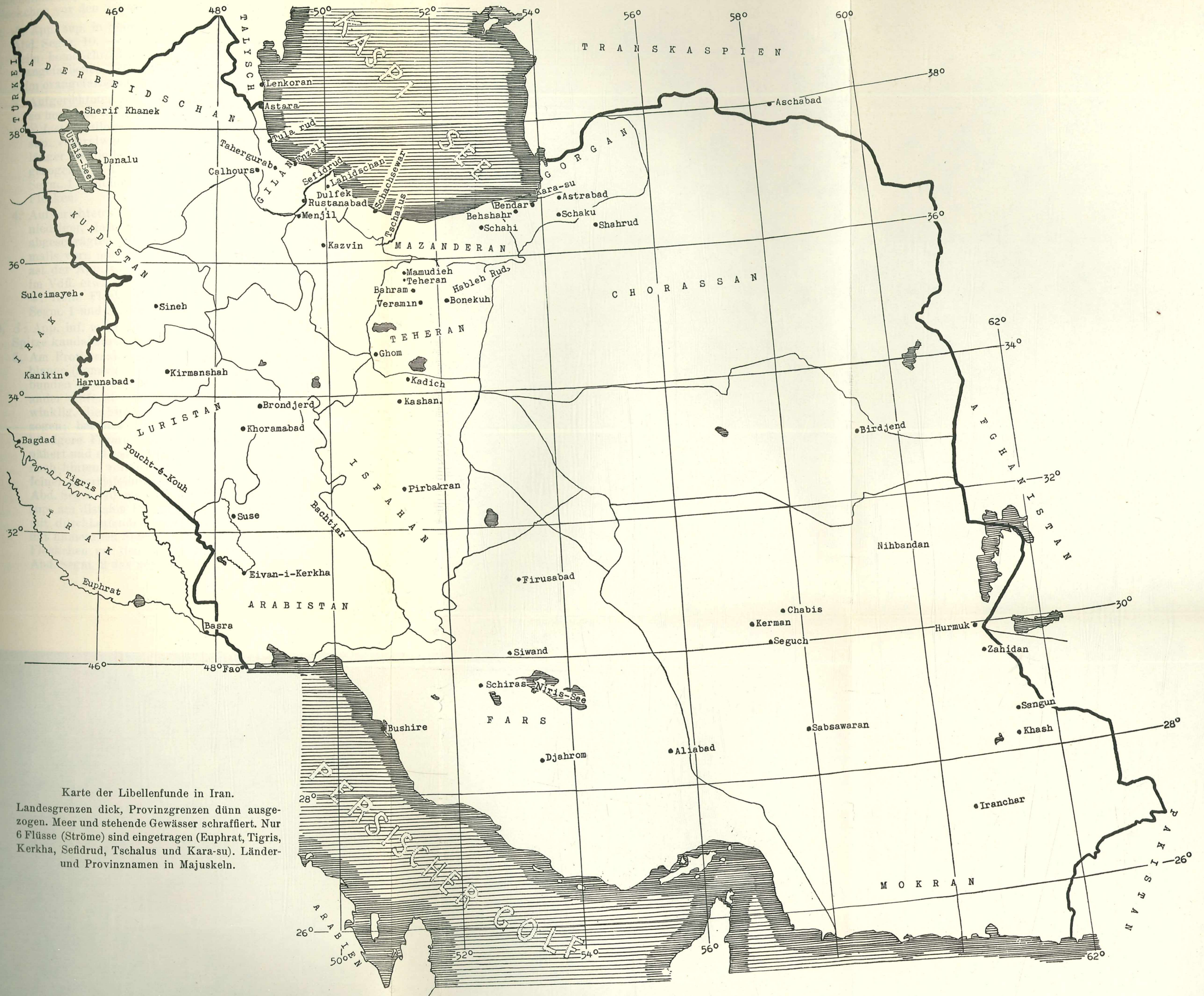
Karte der Libellenfunde in Iran. Landesgrenzen dick, Provinzgrenzen dünn ausgezogen. Meer und stehende Gewässer schraffiert. Nur 6 Flüsse (Ströme) sind eingetragen (Euphrat, Tigris, Kerkha, Sefidrud, Tschalus und Kara-su). Länder- und Provinznamen in Majuskeln.