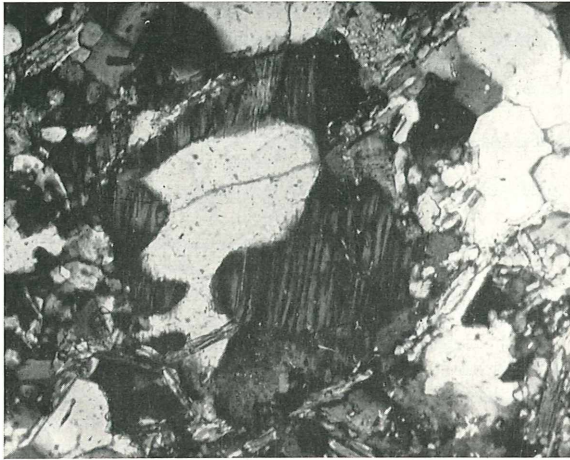
Abb. 1. Gneisaplit (Gerölle) von Krieglach. — Im Spindelperthit ( \varnothing = 0,4\text{mm} ) ein „Korrosionsquarz“, gestaltlich ähnlich einem Porphyrquarz, diesfalls aber entstanden durch Metasomatose bei der Perthitkristallisation. Nic. +