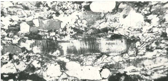
Abb. 2 u. 3. Gneisaplit (Gerölle) von Krieglach. — Im Schiefergewebe aus Quarz, Albit und Feinmuskowit befinden sich in „s“ langgestreckte Mikroklin-Porphyroblasten. Länge = 0,9 mm (oben) und 0,8 mm (unten). Nic. +