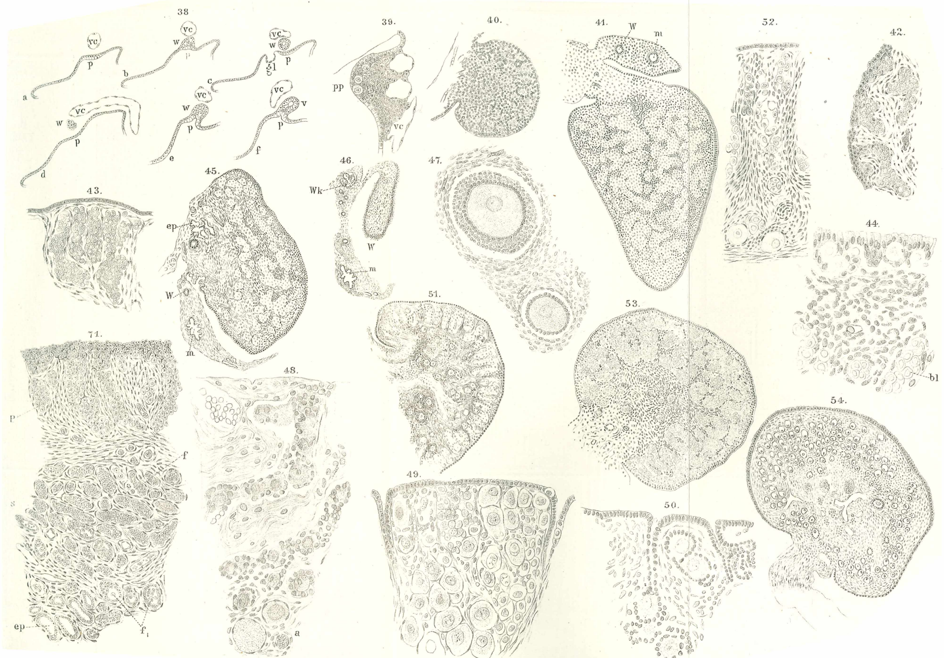
Fig. 38, 39, 42, 43, 71 autor cetera Rejšek ad n. del. lith. v. Df. J. Matzmann