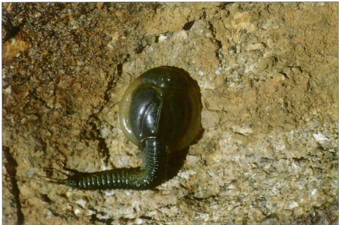
Abb. 2 (unten): Triops australiensis (SPENCER & HALL 1895), der einzige Vertreter der Gattung Triops in Australien. 22.1.1992.