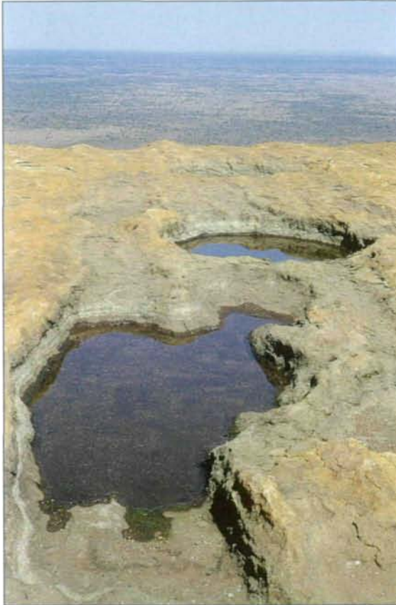
Abb. 1: Kurzfristig wasserführende Standorte (sog. „astatische Gewässer“) sind weltweit typische Urzeitkrebshabitate: Selbst in regelmäßig trockenfallenden Felstümpeln auf dem Ayers Rock, einem der bekanntesten Touristenziele in Australien, lebt ein notostraker Krebs: Triops australiensis. 22.1.1992.