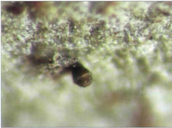
Fig. 2: Licea spec. (E. 5426), eine unbeschriebene Art auf der Blattunterseite von Grias tessmannii (Lecythidaceae). Sporocarp im Zentrum des Bildes etwa 0,08 mm im Durchmesser.

Diese Beobachtungen geben natürlich nur einen begrenzten Blick auf das Vorkommen foliicol fruktifizierender Myxomyceten in den Tropen. Die Tatsache, daß sich neue Arten bei der Untersuchung von Herbarmaterial höherer Pflanzen finden (diese ohne Beachtung auf eventuelles Myxomycetenvorkommen gesammelt), zeigt, daß lebende Blättern des tropischen Regenwaldes ein interessantes Substrat für Myxomyceten darstellen. Gezielte Beachtung dieses Lebensraumes wird sicher zur Entdeckung neuer Arten führen.