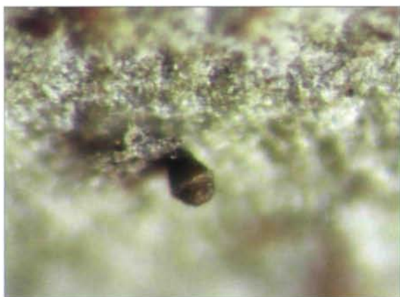
Fig. 2: Licea spec. (E. 5426), eine unbeschriebene Art auf der Blattunterseite von Grias tessmannii (Lecythidaceae). Sporocarp im Zentrum des Bildes etwa 0,08 mm im Durchmesser.

Diese Beobachtungen geben natürlich nur einen begrenzten Blick auf das Vorkommen foliicol fruktifizierender Myxomyceten in den Tropen. Die Tatsache, daß sich neue Arten bei der Untersuchung von Herbarmaterial höherer Pflanzen finden (diese ohne Beachtung auf eventuelles Myxomycetenvorkommen gesammelt), zeigt, daß lebende Blättern des tropischen Regenwaldes ein interessantes Substrat für Myxomyceten darstellen. Gezielte Beachtung dieses Lebensraumes wird sicher zur Entdeckung neuer Arten führen.