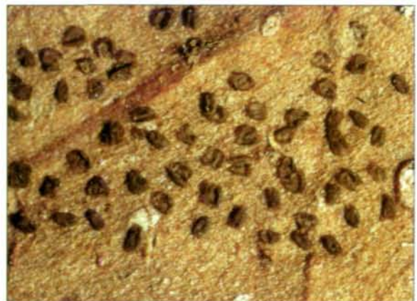
Fig. 1: Offene, sporenfreie Fruktifikationen von Licea aff. biforis (E. 5428), etwa 0,25 mm lang, auf der Blattunterseite eines unbestimmten Angiosperms.

Eine Gruppe von Fruktifikationen auf der Blattunterseite eines unbestimmten Laubbaumes (Prov. Pastaza, Mera, 23. Mai 1968, leg. G. HARLING 9689, Reg.Nr. E.5428) gehört, den Bestimmungsschlüsseln verschiedener Monographien folgend, zu Licea biforis MORGAN und wurde auch von GILERT (1997) dieser Art zugerechnet. Die sitzenden Fruktifikationen (Fig. 1) sind 0,25-0,30 mm lang, etwa 0,1 mm breit,