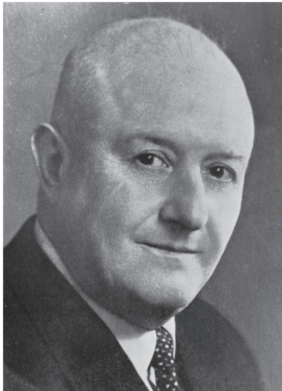
Fig. 3: Georg Cufodontis. Fuente: PIGNATTI & PIGNATTI (1975)

En Costa Rica, la crisis económica generada por esta coyuntura provocó la caída de los precios internacionales del café y del banano, que constituían el grueso de las exportaciones costarricenses al mercado internacional, situación que fue agravada por la contracción experimentada en las importaciones, la devaluación del colón, el agotamiento de la frontera agrícola -que otrora compensaba las crisis mediante la apertura de nuevos frentes de colonización-, el desgaste paulatino de los suelos aptos para la agricultura, la expansión de plagas en las plantaciones y el creciente aumento de la conflictividad social en las áreas rurales y urbanas. 15 Esta situación provocó una mayor intervención del Estado en la economía costarricense y en el ámbito comercial, llevó a la búsqueda de nuevos mercados para colocar la producción cafetalera nacional, por lo que se estudió la posibilidad de aumentar las ventas a otros países, entre ellos Austria, nación que mencionó por primera vez a la república centroamericana como proveedor de café en sus libros de estadísticas comerciales en 1928. 16