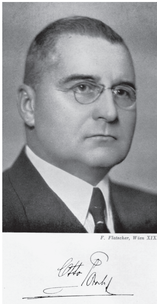
Fig. 1: Dr. Otto Porsch.

Costa Rica, entre ellos el geólogo alemán Karl Sapper (1866-1945) y el botánico estadounidense Phillip Calvert (1871-1961). 5