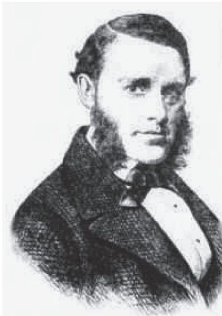
Fig. 2: Karl von Scherzer: Fuente: “Karl Ritter von Scherzer (1821-1903)”, s.f.