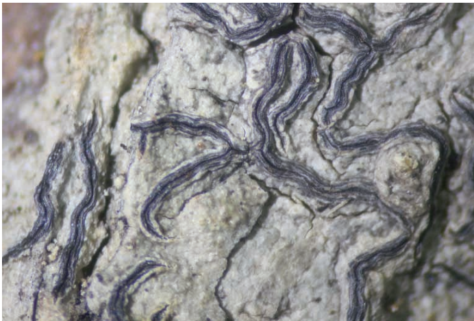
Abb. 3: Graphis elegans – Zweiter Nachweis für Österreich, Beleg F.Grimms 1967, Bildbreite 12 mm.