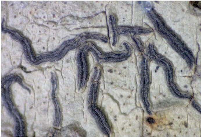
Abb. 1: Graphis elegans – Erstfund für Österreich, Beleg H.Haslinger 1932, Bildbreite 10 mm.