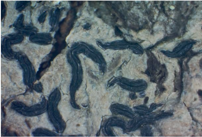
Abb. 5: Graphis elegans – Beleg V. Pfefferkorn 1991.