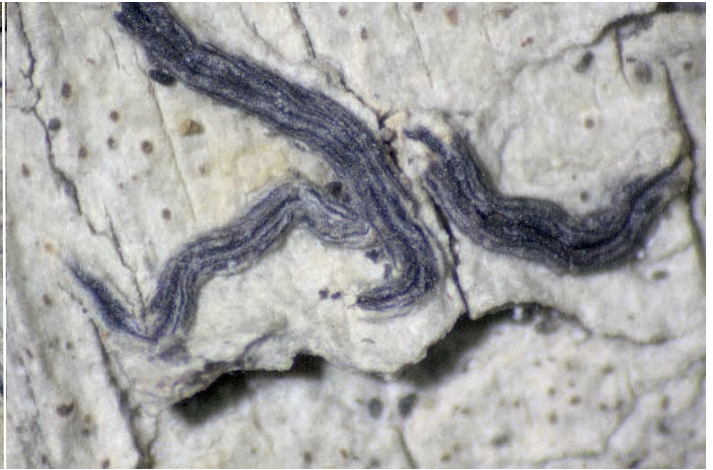
Abb. 2: Graphis elegans – Erstfund für Österreich, Beleg H.Haslinger 1932, Bildbreite 8 mm.