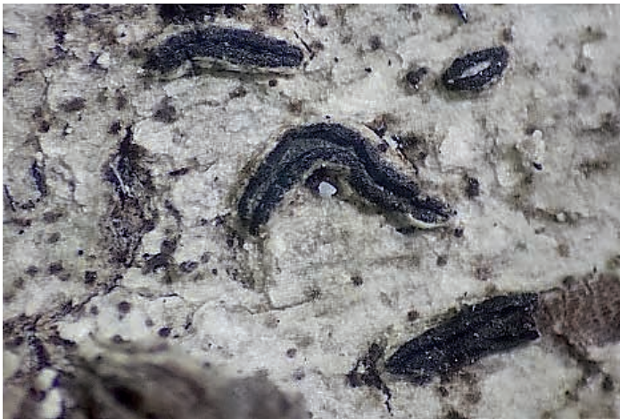
Abb. 7: Graphis elegans – Beleg Nr.: 7333, Fruchtkörper, Länge 1,8 mm.