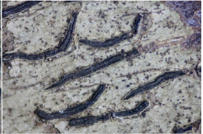
Abb. 6: Graphis elegans – Beleg Nr.: 7333, Herbarium GJO; Bildbreite 7 mm.