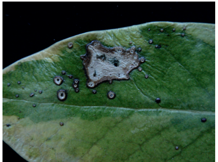
Abb. 6: Phyllosticta terminalis Blattflecken an Ilex sp.