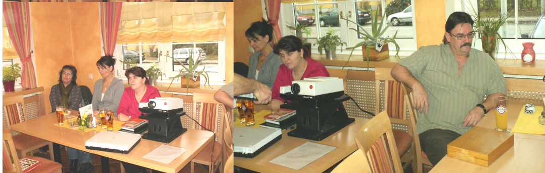
Autor: Anton Leimhofer

Immer wieder ein schönes Bild, wenn unsere Ur-Entomologen die Zusammenkunft wahrnehmen und Geschichten von Damals erzählen.