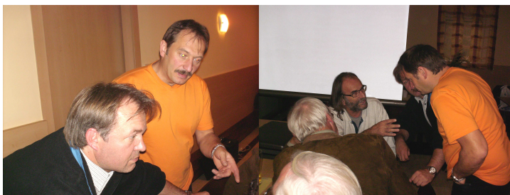
Autor: Anton Leimhofer

Eine eifrige Diskussion entwickelte sich bereits unter dem Vortrag, so dass sich der Vortragende verbal in den Mittelpunkt setzen musste, was ihm nicht schwer fiel und dem Nachmittag eine besondere Würze gab, so dass man Frankreich fast schmeckte. Wir freuen uns bereits auf Teil 2 (Frankreich im Herbst).