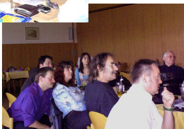
Autor: A. Leimhofer

Ende Oktober fuhren Sie ein drittes Mal in das Land der Franzosen, wo das Sammelgebiet Notre Dame de Londres, Aigus Mortes und Avignon war. Zum Schluss gab es noch ein paar Bilder über einen Sammeltag am 23. Dezember in Litschau.