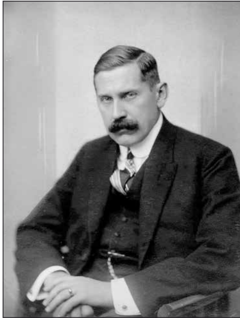
Abb. 1: Othenio ABEL, der Begründer der „Paläobiologie“. – Fig. 1: Othenio ABEL, founder of palaeobiology.

Im Juni 1911 verwendete der damals 36-jährige Othenio ABEL als tit. ord. Professor für Paläontologie an der Universität Wien erstmals den Begriff Paläobiologie in seinem Manuskript für das im Jahr 1912 erschienene Werk „Grundzüge der Paläobiologie der Wirbeltiere“ (Stuttgart, Schweizerbart'sche Verlagsbuchhandlung). Daher gilt das Jahr 1912 als Gründungsjahr der Paläobiologie. Das Buch ist Louis DOLLO, dem damaligen Konservator am Königlichen Naturhistorischen Museum in Brüssel (Belgien) gewidmet, der im Jahr 1910 den Begriff „Paléontologie éthologique“ für seine Arbeitsrichtung geprägt hatte. Ein Begriff, der sich jedoch international nicht durchsetzen sollte.