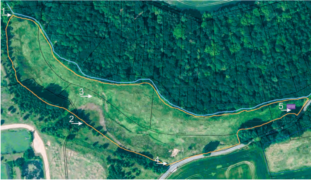
Abb. 1: Nummern und Standorte der Fallen auf der Rinderweide bei Ceesewitz (Luftbild nach Norden ausgerichtet, WW = Wasserwagen als Rindertränke).