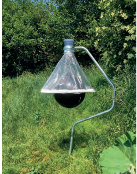
Abb. 2: Bremsenfalle (schwarzer Gummiball, Fangschirm, Halterungsgestänge, oben Fangbehälter).

Zum Zeitpunkt des Versuches weideten 12 Mutterkühe, 14 Kälber und ein Bulle der Rasse Uckermärker. Die Fänge erfolgten in zwei Blöcken. Am 19.06.2018 erfolgte der Aufbau der Fallen gegen 10 Uhr. Gegen 16 Uhr wurde die Herde auf die Weide getrieben. Die Leerungen der Fallen erfolgten bis zum 22.06.2018 täglich um 10 Uhr. Der zweite Fangblock begann am 20.08.2018 mit dem Aufbau an den identischen Positionen wie im vorhergehenden Untersuchungszeitraum. Jedoch wurden nun Fänge getätigt, ohne dass sich eine Herde auf der Weide befand. Es folgten tägliche Entleerungen gegen 10 Uhr bis zum 25.08.2018. Somit ergeben sich fünf Fangtage ohne Viehbestand.