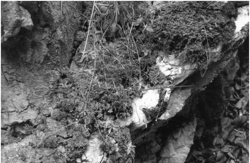
Abb. 9: Das Gips-Fettkraut besiedelt an seinem Sekundärstandort einen von Gipsfelsen und Blaugrasfluren geprägten nordexponierten, aber lichtoffenen Unterhang eines Erdfalltrichters, 2 bis 8 m über der Wasserfläche.