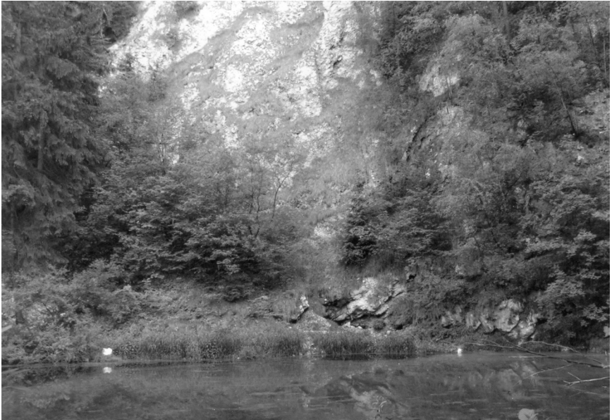
Abb. 8: Blick auf den „Igelsumpf“ bei Woffleben, die neue Heimstadt des vor dem Aussterben geretteten Gips-Fettkrauts.