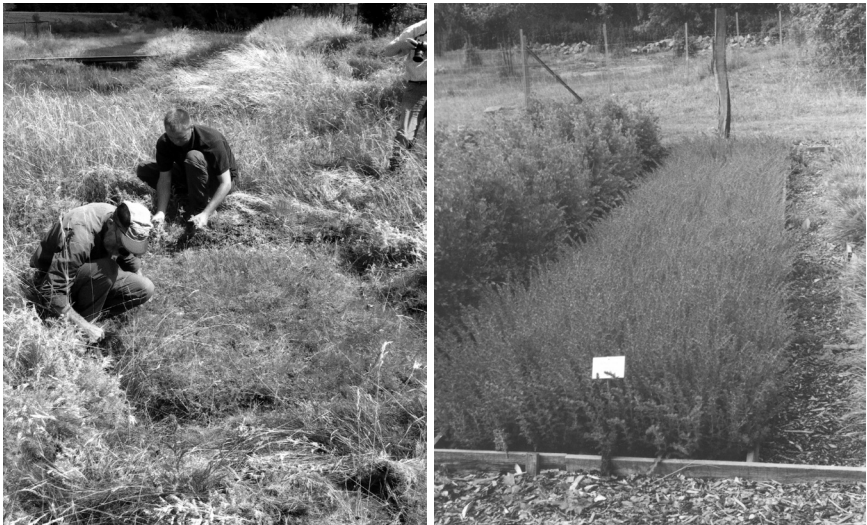
Abb. 6: Artemisia rupestris (Gefährdungskategorie: SA 0, TH 1): Beetkultur im NSG Solgraben bei Artern. Durchführung von Pflegearbeiten.