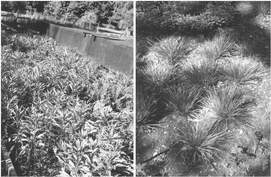
Abb. 4 (links): Senecio sarracenicus (Gefährdungskategorie: SA 2): Beetkultur im Schutzgarten an der Kapenmühle, rechts hinten Schattenanlage für Omphalodes scorpioides (Gefährdungskategorie: SA 2).