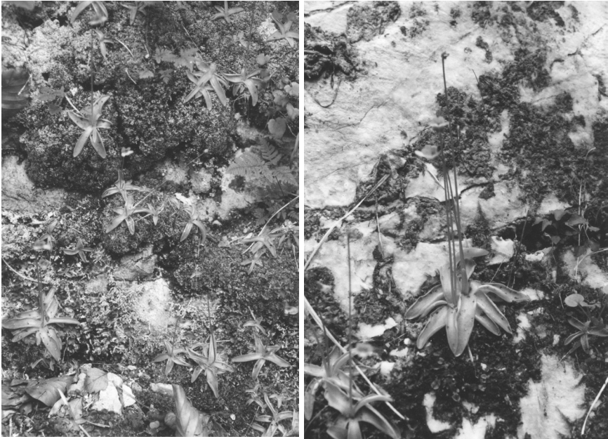
Abb. 10, 11: Gips-Fettkraut: Die Gips-Unterlage, die relativ hohe Luft- und Bodenfeuchte, der lichtoffene, aber nicht sonnige Standort sowie die Konkurrenzarmut an Felsen und in lückigen Bereichen zwischen den Sesleria -Horsten sind offensichtlich bezeichnende Standortsfaktoren dieser stenöken Sippe.