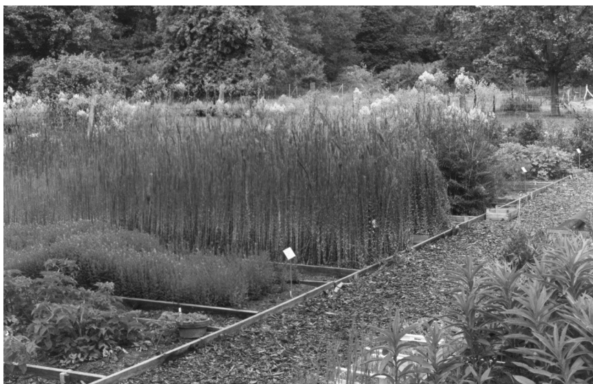
Abb. 1: Schutzgarten an der Kapenmühle im Biosphärenreservat Mittelelbe. Beet vorn links: Angelica palustris (Gefährdungskategorie: SA 1), Beet im Mittelgrund mit hohen Pflanzen: Arabis nemorensis (Gefährdungskategorie SA 1).